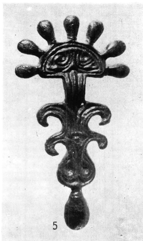
Pl. 1. — 1, 5, Fibulă digitată și colier de la Cornești, jud. Cluj ; 2—4. Cercel de argint de la Moldovenești, jud. Cluj.