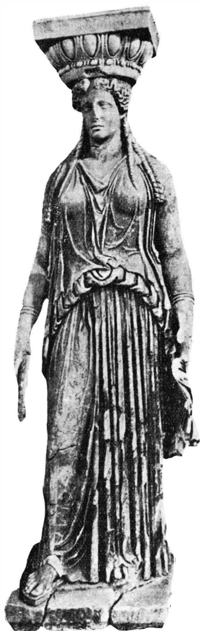
Fig. 2. — Tivoli, villa Hadriana. Una dintre cele patru cariatide recent descoperite.

la Uffizi și de la Mantova — au determinat pe A. Bartoli să plaseze cronologic relieful în epoca în care Caesar pune bazele imperiului și Octavian îl realizează : fiind datorită atât unuia cât și celuilalt. în centrul politic al orașului se renovează reședința senatului și, alături de ea, se înalță pe de o parte templul Venerei Genetrix, din care cobora Enea și ginta Iulia, pe de altă parte, în bazilica Emilia renovată, se așterne reprezentarea originilor Romei, lucru de neîndoiebnică semnificație politică.