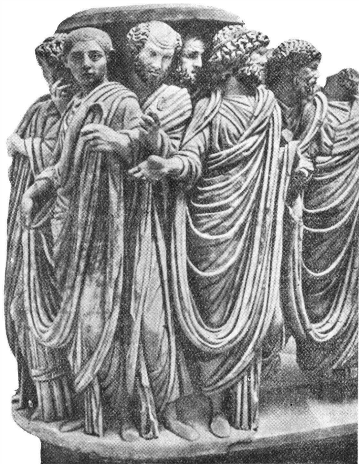
Fig. 3. — Roma. Sarcofagul de la Acilia.

Între figurile bărbătești ale compoziției, în esență clasice și de o mare virtuozitate de execuție (vezi pe de o parte abstractizarea ornamentală a bărbii și a părului bogat și „baroc” lucrat aproape ca o dantelă cu o delicată minuire a trepanului și a dălții, pliurile foarte adânci