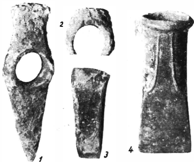
Fig. 1. — 1, Topor de aramă cu tăişuri opuse; 2, fragment de topor-ciocan; 3, topor plat cu marginile ridicate; 4, celt de bronz.

2. Araci (r. Sf. Gheorghe, reg. Braşov). În primăvara anului 1966 un elev a găsit în hotarul comunei un topor plat de aramă cu marginile ridicate. Piesa a fost donată muzeului de prof. Z. Deneş. Descoperi-