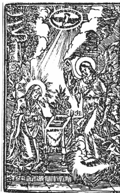
Pl. III. 1. Ghervasie Monah, Maica Domnului cu Pruncul, Rânduiala cântării celor 12 psalmi deosebi , București, 1820; 2. Ghervasie Monah, Bunavestire, Acatist , București, 1823; 3. Ioanițiu Endrédi, Bunavestire, Acatistiaru , Blaj, 1763