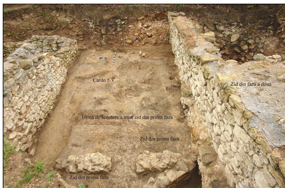
Fig. 8. Cardo 5 vest

Sub cardo 5 vest am surprins urme de structuri din piatră acoperite de drum și suprapuse de zidurile extrem de late al unei noi clădiri, Z_{19} = 1,15 m, iar Z_{21} = 1,75 m ( Fig. 8 ). Aceasta a fost singura construcție din Insula 3 în cadrul căreia am descoperit numeroase fragmente de placaj din marmură de Bucova. La celelalte clădiri din suprafață, marmura nu apare decât în contextul refolosirii în pereții canalelor târzii.