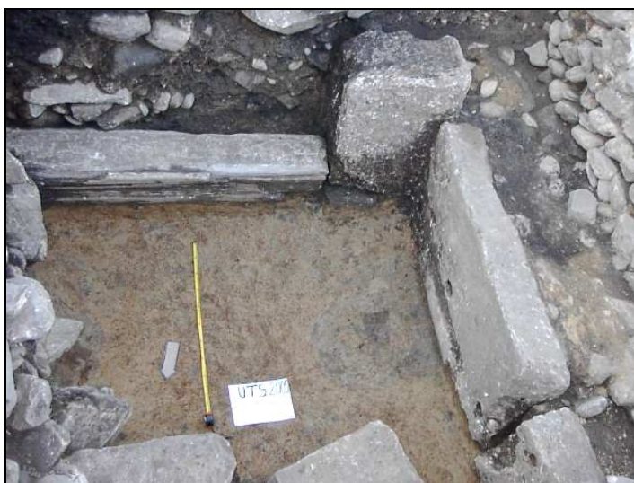
Fig. 5. Structuri târzii

Pe proprietatea Oproni ( Fig. 2 ), situată peste drumul care merge spre Hobița, la mică distanță față de incinta de apus, nu am descoperit nici un fel de structuri sau material arheologic, doar bolovani de dimensiuni foarte mari, folosiți, poate, ca material de construcție la un moment dat 46 . Dacă ne îndreptăm și mai spre vest am putea să ajungem până la