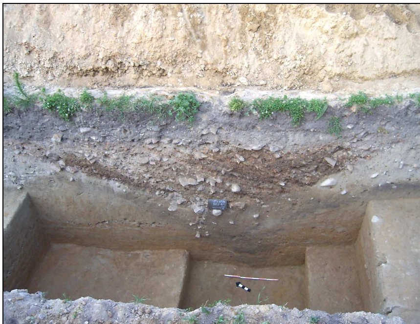
Fig. 3. Șanțul cu două faze

În schimb, între secțiunile arheologice și zidul de nord se întindea pe direcția E-V un șanț de dimensiuni mari, cu două faze de funcționare ( Fig. 3 ).