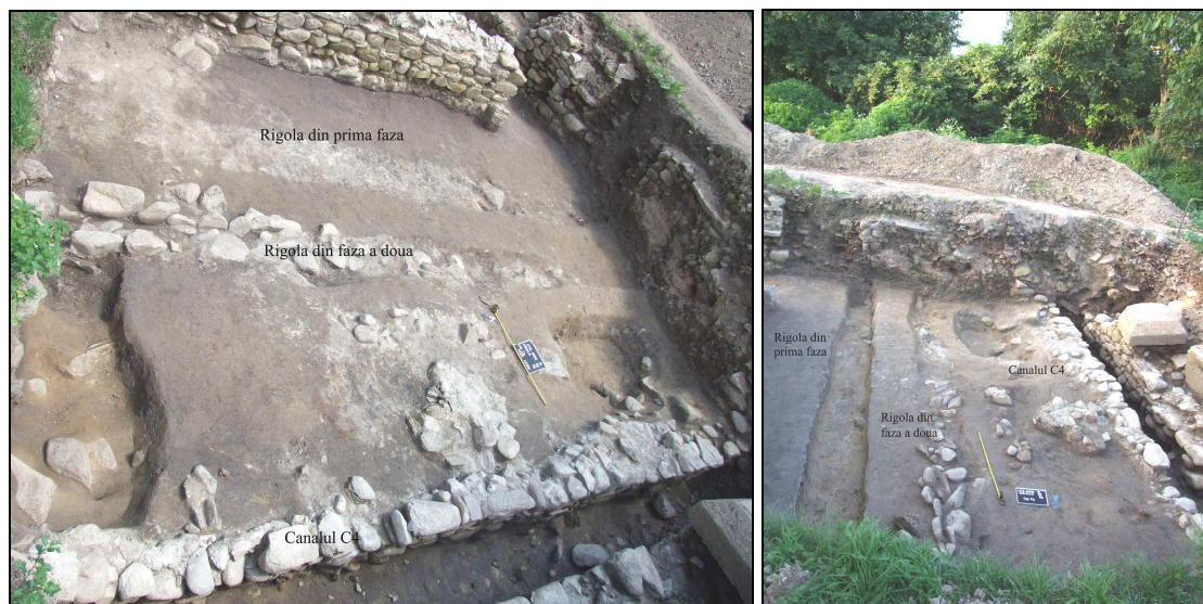
Fig. 6. Cardo 4 vest

în canalele târzii, ce aparțineau colonadei de la cardo sau de la decumanus 60 . Pe cardo 4 vest am surprins o primă rigolă a drumului astupată și mutată la aproximativ 1,5 m spre vest ( Fig. 6 ). Clădirea de la sud de canalul roman C 4 a fost extinsă sau construită în funcție de cea de-a doua rigolă.