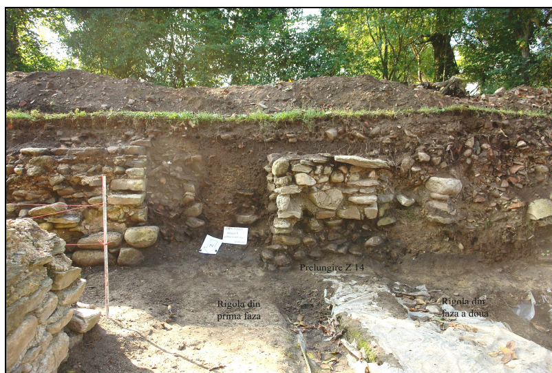
Fig. 7. Prelungirea clădirilor spre vest

Dar, dacă ținem cont de observația că toate clădirile construite cu piatră de carieră 61 provin din fazele de început ale orașului, și având în vedere că partea de est a zidului Z 14 este construită cu un astfel de material, probabil că avem doar o prelungire a construcției ( Fig. 7 ). Și în acest caz s-au păstrat fragmente de coloană, capiteluri sau postamentele porticului, care sunt tot din travertin sau calcar.