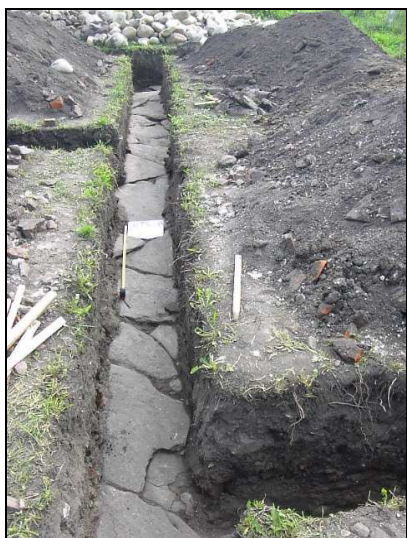
Fig. 4. Pavaj din lespezi

În partea de apus, tot în afara zidurilor de incintă, pe lângă templele și descoperirile mai vechi, se adaugă și altele mai noi. În zona grădiniței, situată peste drum de căminul cultural, au fost cercetate clădirile EM 5 și EM 6, una dintre ele beneficiind de instalație de hipocaust 44 . În apropiere, pe proprietatea Huniadi ( Fig. 2 ), învecinată spre E cu grădinița, cu prilejul unei săpături de salvare au fost descoperite ziduri din piatră poziționate, probabil, în jurul unei curți din care s-a păstrat pavajul făcut din lespezi masive ( Fig. 4 ). Nu au fost surprinse clădiri de lemn, în schimb avem de-a face cu structuri târzii, care au refolosit piese arhitectonice romane (au putut fi identificate două fragmente de la un prag de ușă), foarte asemănătoare cu cele descoperite în Insula 3 45 ( Fig. 5 ).