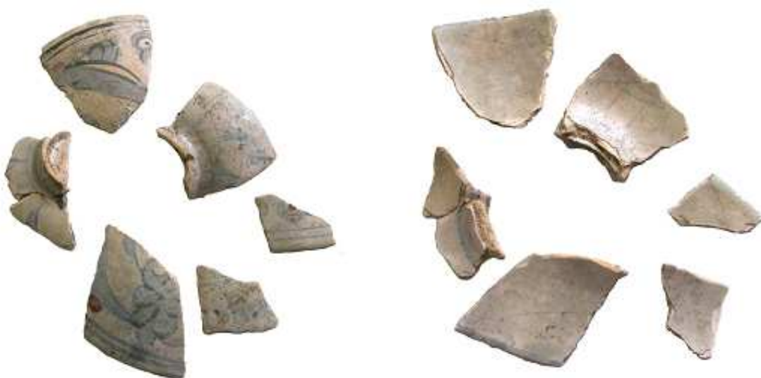
Fig. 7. Bolul oriental, imagine față/verso după descoperire