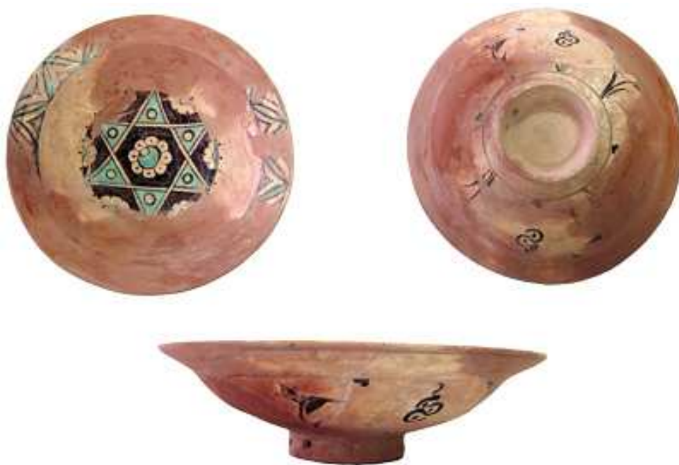
Fig. 4. Farfuria, după etapa de plombare