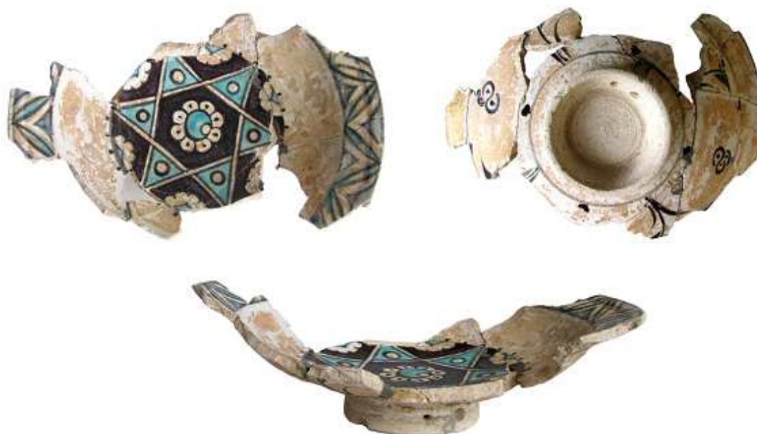
Fig. 3. Farfuria, după etapa de lipire a fragmentelor