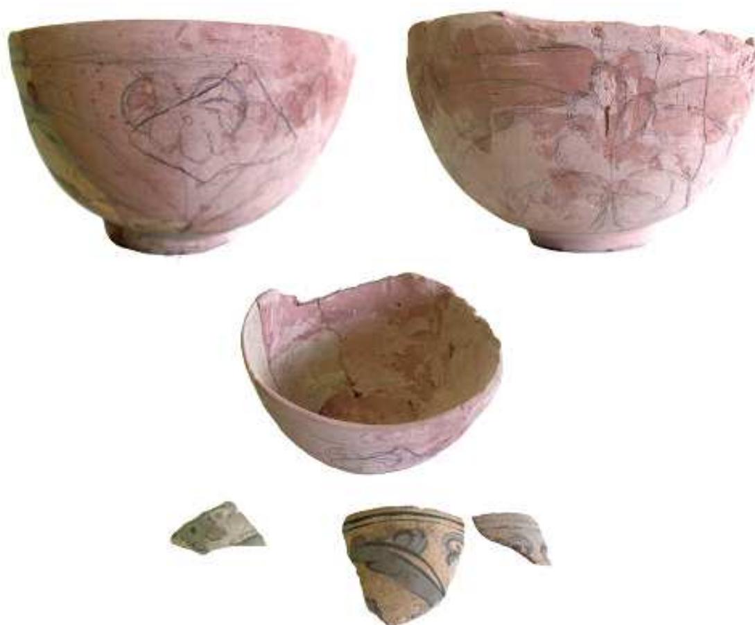
Fig. 9. Bolul oriental, etapa de reconstituire a decorului