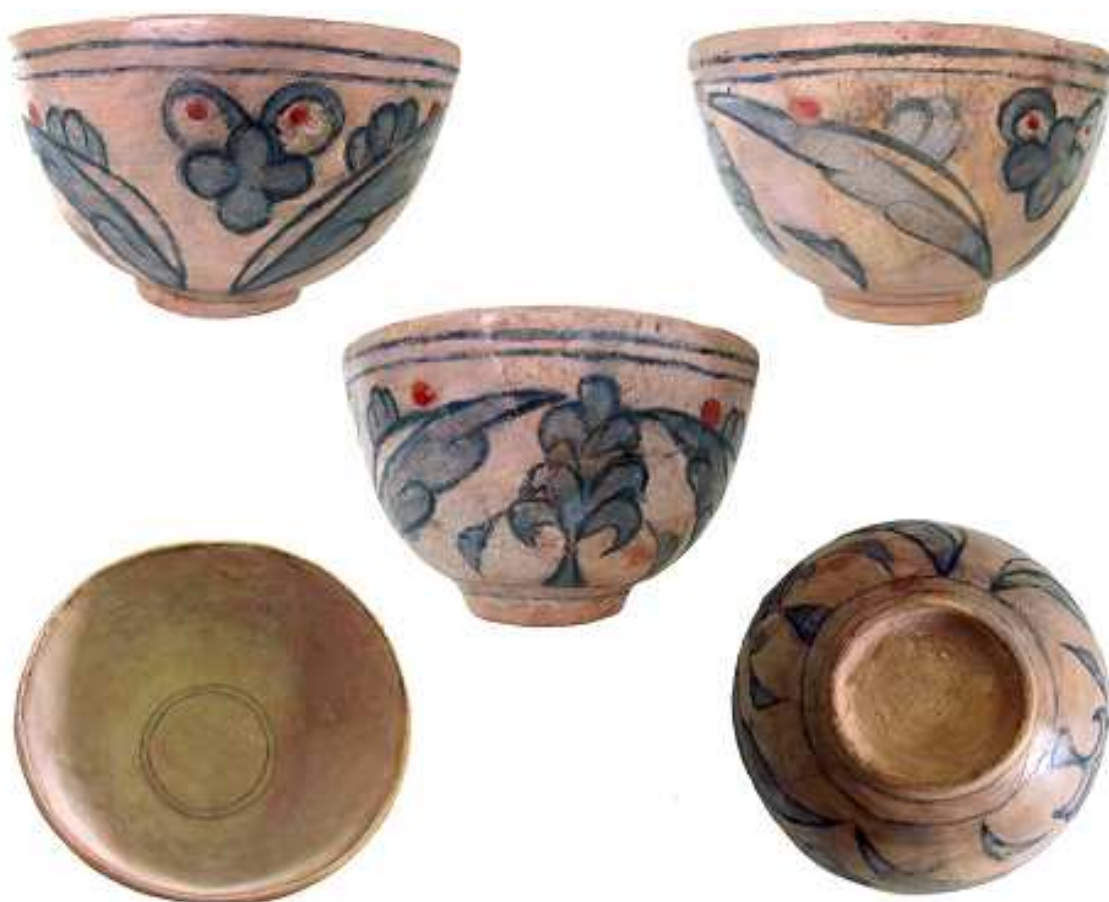
Fig. 13. Bolul oriental, faza finală