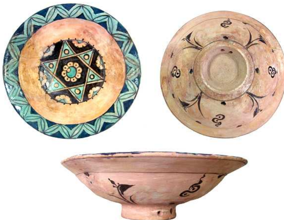
Fig. 5. Farfuria din sec. XV, etapa finală