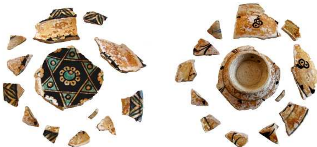
Fig. 2. Farfuria, după etapa de curățire și impregnare