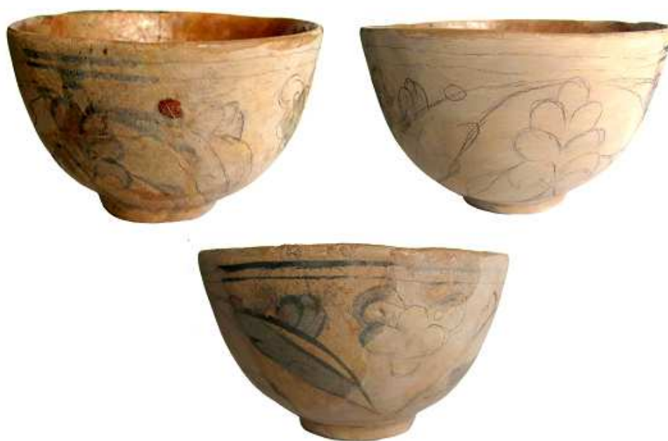
Fig. 12. Bolul oriental, după etapa de reconstituire a continuității decorului