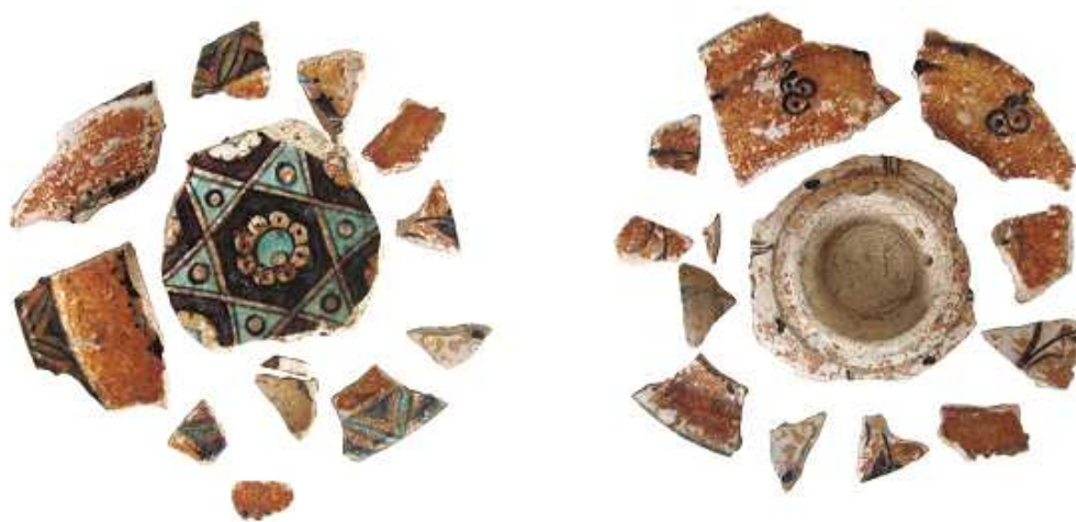
Fig. 1. Farfuria, imagine față/verso, după prelevare