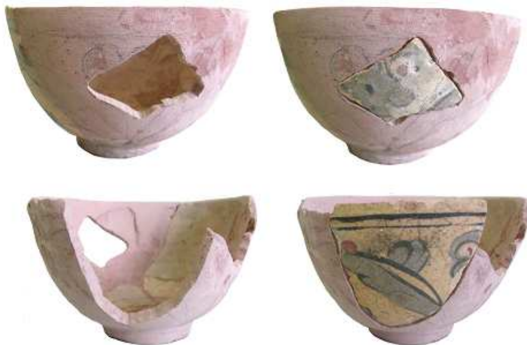
Fig. 10. Bolul oriental, etapa de amplasare a celor trei fragmente