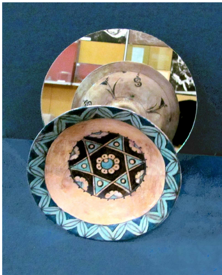
Fig. 6. Farfuria din sec. XV, imagine din expunere