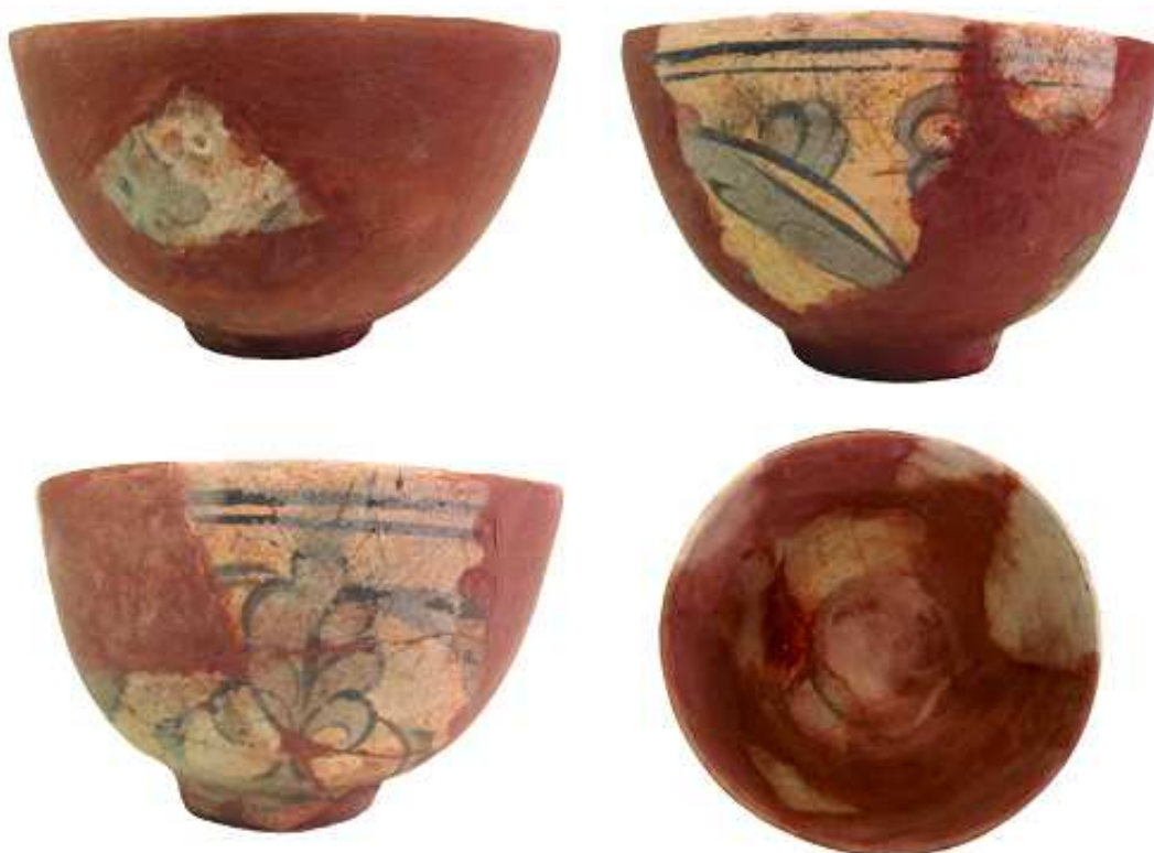
Fig. 11. Bolul oriental, după etapa de plombare