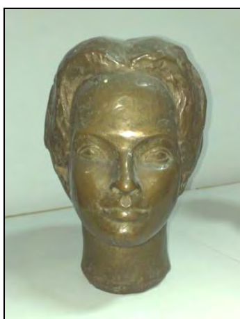
Fig. 13. – Anonim, Cap de femeie