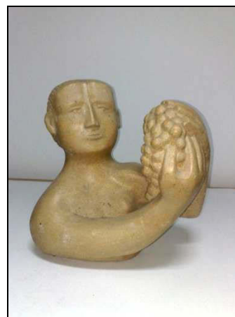
Fig. 3. – Gh. Mureșan, Tânăr cu strugure