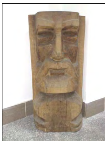
Fig. 14. – Anonim, Cap de bărbat