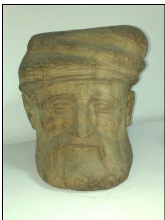
Fig. 1. – Gh. Mureșan, Tarabostes