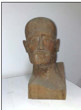
Fig. 2. – Gh. Mureșan, Cap de bărbat