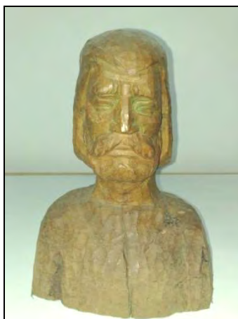
Fig. 11. – Anonim, Horea