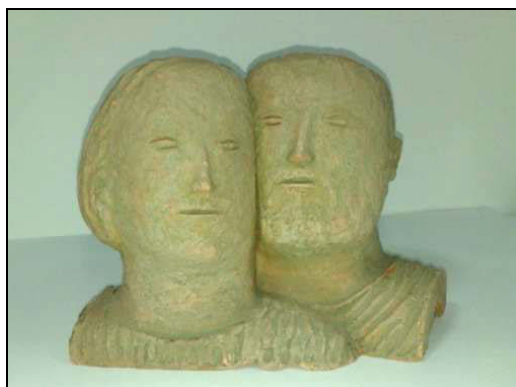
Fig. 4. – Gh. Mureșan, Dublu portret