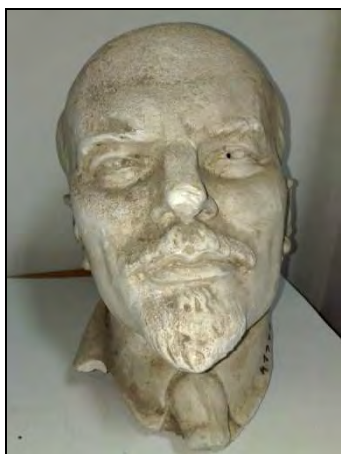
Fig. 10. – Anonim, Lenin