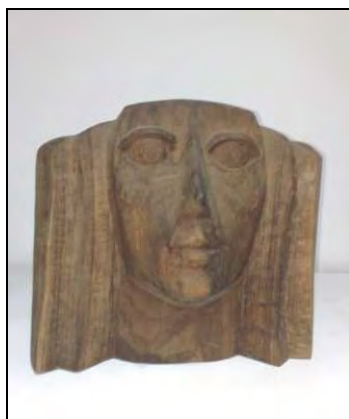
Fig. 5. – Ioan Șeu, Cap de fată