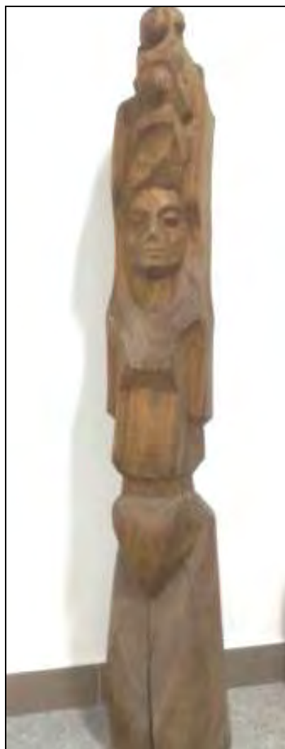
Fig. 6. – Ioan Șeu, Femeie