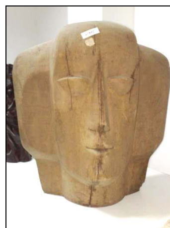
Fig. 15. – Anonim, Cap de fată