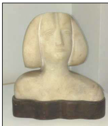
Fig. 7 – Ioan Șeu, Portret de fată