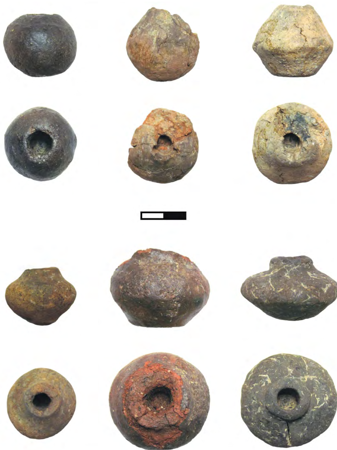
Pl. III – Capete de băț, de diferite forme, fără decor.