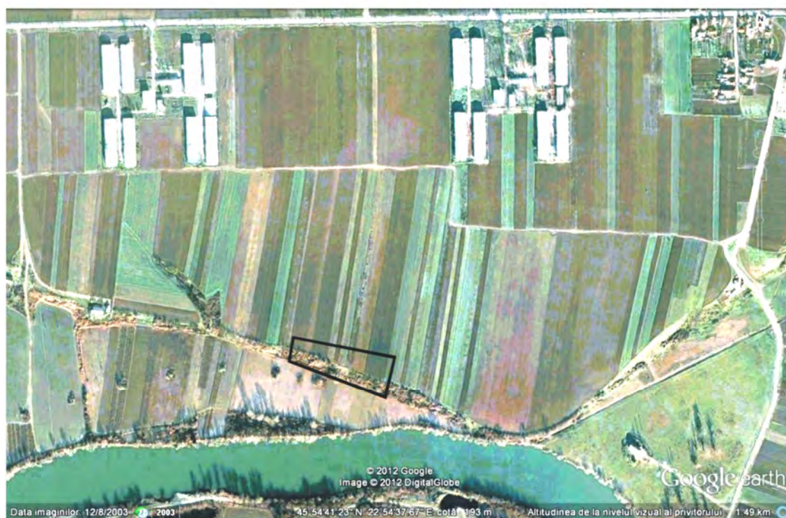
Pl. I – Imagini din satelit asupra Culoarului Mureșului (sus) și a punctului Șoimuș - „Teleghi”, cu sectorul cercetat, în chenar (jos).