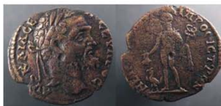
Fig. 12 - Monedă de la Septimius Severus