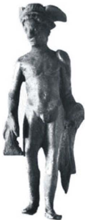
Fig. 8 - Statuetă Mercur, Ulpia Traiana Sarmizegetusa