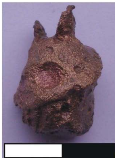
Fig. 5 - Cap statuetă Mercur, spate