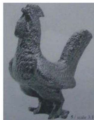
Fig. 10 - Statuetă cocoș, Durostorum