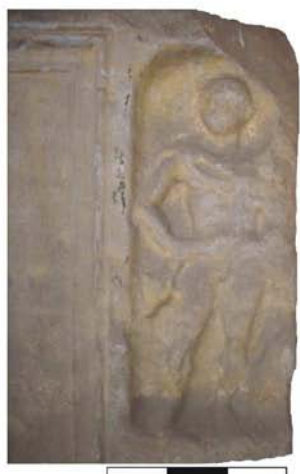
Fig. 11 - Placă funerară, Ulpia Traiana Sarmizegetusa