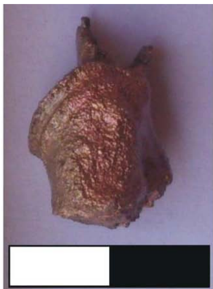
Fig. 4 - Cap statuetă Mercur, față