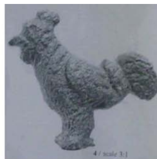
Fig. 9 - Statuetă cocoș, Durostorum