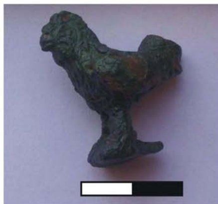
Fig. 7 - Statuetă cocoș, partea stângă