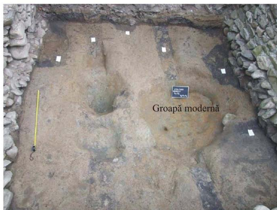
Fig. 3 - Contextul descoperirii