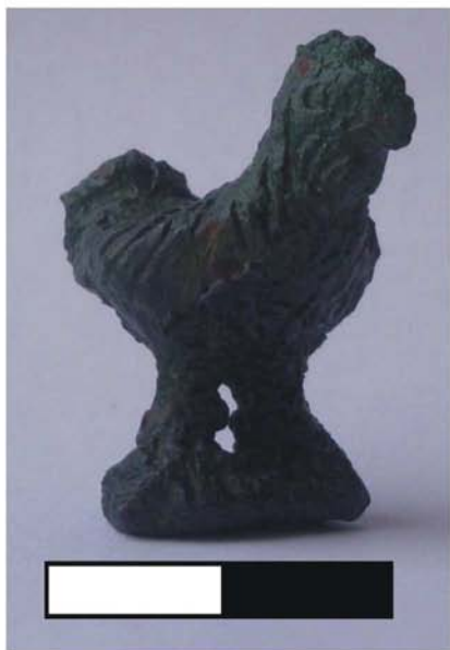
Fig. 6 - Statuetă cocoș, partea dreaptă