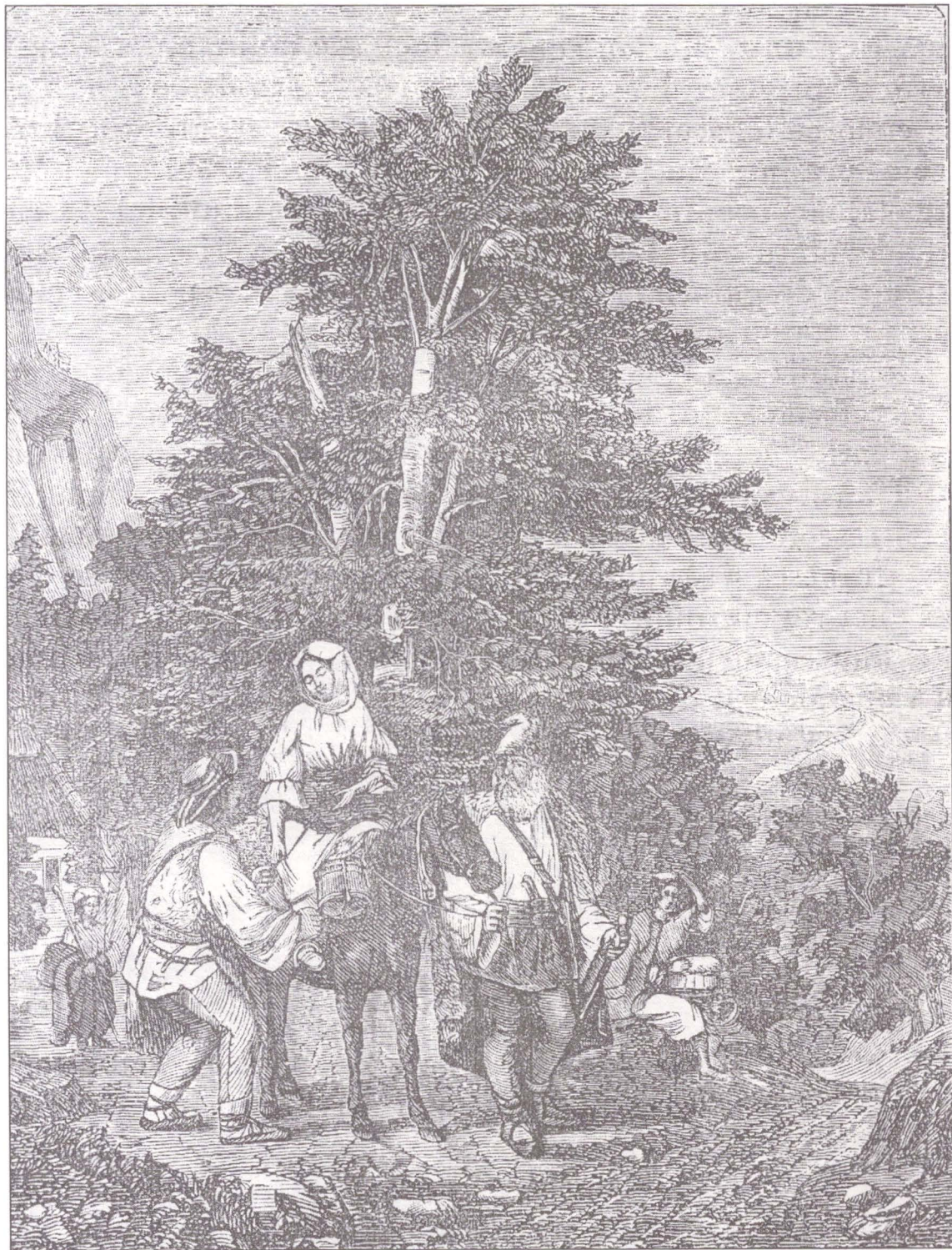
Români din Bărăști - Hațeg