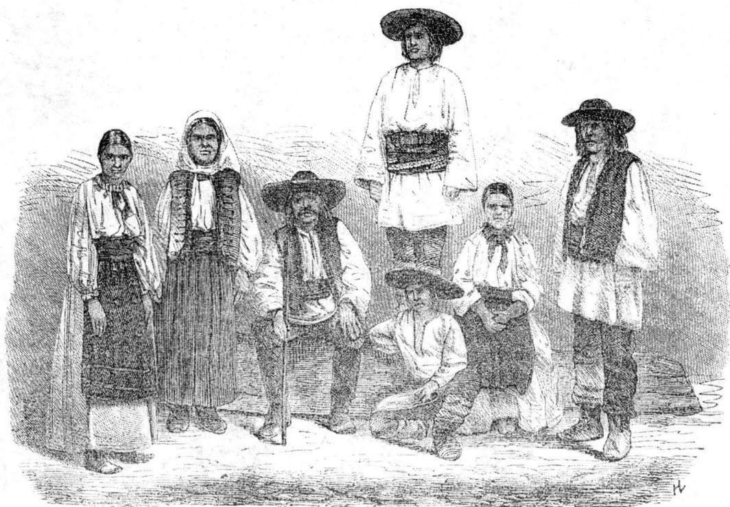
Români din Valea Mureșului