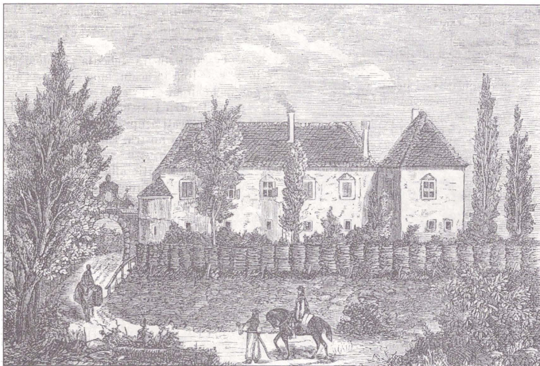
Castelul Martinuzzi din Vințu de Jos