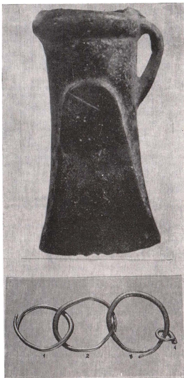
Fig. 1 — Obiectele descoperite la Buituri (a) celt de tip transilvănean, (b) fragment de lanț de aur.