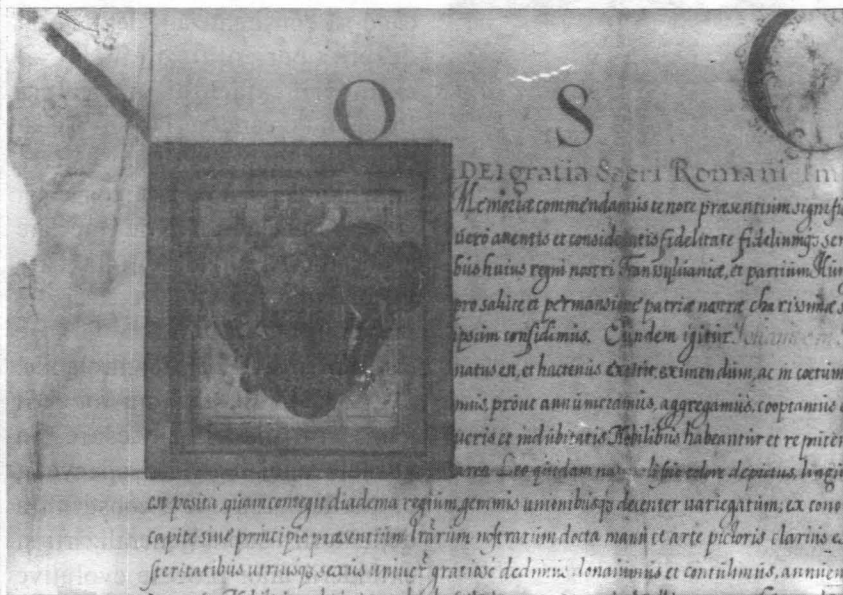
Fotografie reprezentând document medieval pe pergament. Imagine după restaurare

Cu totul alta este situația actuală a depozitului de documente al Muzeului din Alba Iulia. Acțiunile legate de acest depozit au vizat deopotrivă restaurarea pieselor care necesitau acest lucru, în special a colecției de diplome pe pergament, dar și probleme de conservare preventivă. În această idee, s-a încercat de-a lungul timpului să se asigure o stabilitate microclimatică în acest spațiu, care