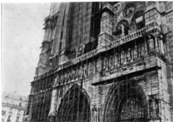
Catedrala Notre Dame — Lucrări de curățire a fațadei de vest.

Curățirea unui edificiu constă în spălarea paramentului cu apă, prin pulverizare. Metoda cunoscută de mai mult timp, a fost în prealabil experimentată pe numeroase monumente din Paris, eficacitatea ei fiind considerată bună, cu condiția ca pulverizarea apei să se producă într-un timp suficient de lung pentru a permite