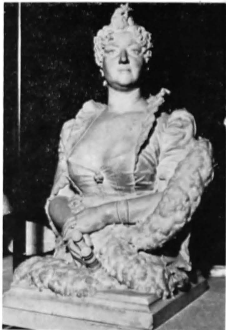
Portretul doamnei N. Blarenberg.

În anul 1898 mai toate ziarurile capitalei « deplîngeau tîndra sculptură românească » pentru pierderea a doi dintre cei mai mari sculptori ai vremii, care se afirmaseră nu numai ca portretişti, dar şi ca realizatori ai unor monumente publice foarte apreciate: primul era renumitul maestru Ion Georgescu, al doilea, foarte apreciat atunci, dar necunoscut acum, George Vasilescu. Opera acestuia din urmă, pe nedrept uitat, merită a fi totuşi cunoscută intrucît, permanent apreciată de amatorii de artă şi sprijinită cu simpatie de oficialităţi, a contribuit cu succes la răspîn-