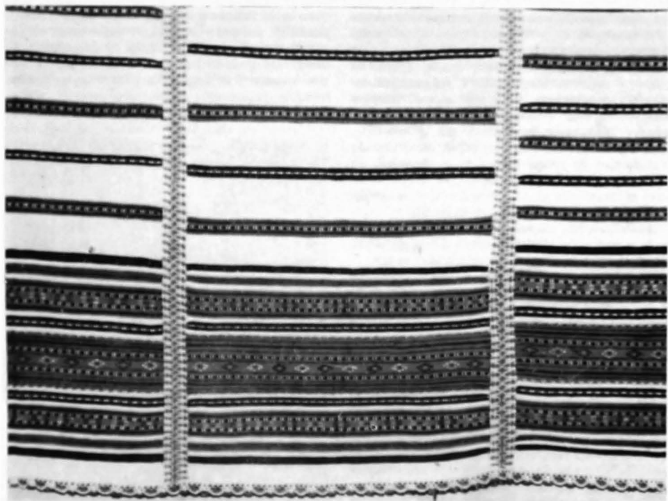
Fig. 1. Lepedeu de pat înalt, detaliu.

Un teritoriu foarte restrâns, situat la granița dintre Țirnavă și Făgăraș, la vărsarea Homorodului în Olt, a fost obiectul unor investigații recente din partea unui colectiv al Muzeului de artă populară al R.S. România 1 .