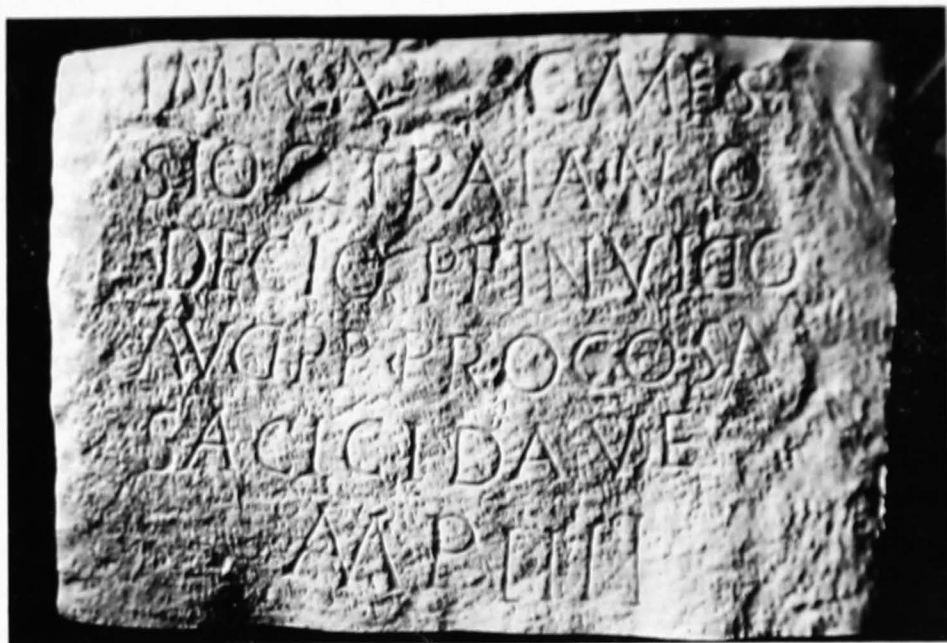
Fig. 2. Inscripția de pe miliar în desfășurare.

Textul, în limba latină, este săpat spre partea superioară a stîlpului, pe șase rînduri și conține litere înalte între 3,5—7 cm. Scrierea are un aspect stingaci, cu unele particularități grafice neesențiale (fig. 1, 2).