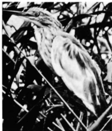
Fig. 2. — Ardeola ralloides .

15. Numenius arquata (L.). În decembrie și ianuarie excepțional și în Europa sud—estică: