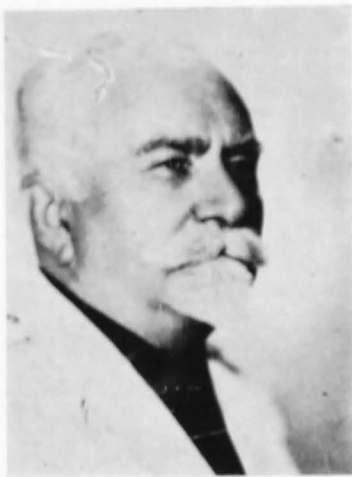
Emil Racoviță (1868-1947).