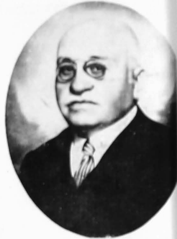
Grigore Antipa (1867-1944).