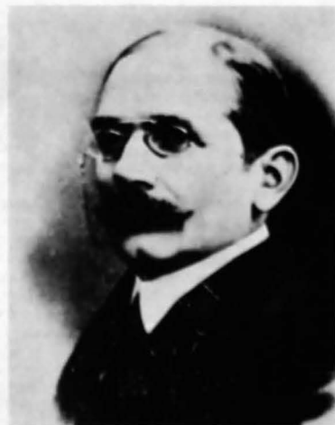
Victor Babeș (1854-1926).