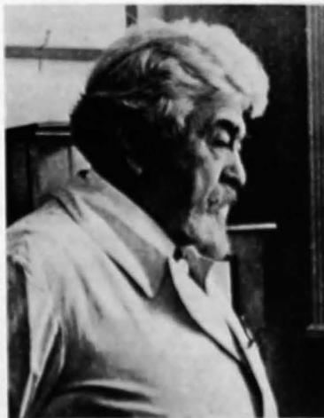
Ioan Cantacuzino (1863-1934).