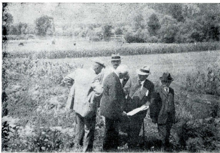
La Micia, iulie 1931

sînt „chipurile în bronz a două din cele mai ilustre și mai reprezentative personalități ale vieții noastre culturale și istoriografiei naționale...” [...] contribuie „cu rodul minții lor superioare și a sufletului lor înalt, prin operi și lucrări epocale la îmbogățirea patrimoniului nostru cultural și național și deci la pregătirea zilelor de glorie și mărire ale înfăptuirii României întregite” 19 . La 28 mai 1928, la Cluj, într-o cuvîntare de excepție, Al. Lapedatu îi comemorează pe memorandiști, punînd pe edificiul redutei placa cu inscripția evocatoare 20 . Tot acum îl evocă pe V. Braniște, închinîndu-i minunate cuvinte 21 . La 3 iunie, cînd se inaugurează, în prezența lui Simion Mehedinți, Emil Racoviță, Gheorghe Țițeica, Grigore Antipa, Mihail Sadoveanu, mausoleul bardului de la Mircești, într-o animată cuvîntare spune: „România întregită e datoare să cultive, în chip cuvenit și demn, amintirea fiilor mari și aleși, cari prin muncă și jertfa lor, prin simțirea și entuziasmul lor, au contribuit mai mult și cu folos la realizarea aceea a idealului ce i-au călăuzit în viață și pe care l-au propovăduit cu credință nestrămutată că va să fie ajuns urmarea cea mai firească a tot ceea ce el însuși au săvîrșit pentru binele și prosperitatea patriei și neamului” 22 .