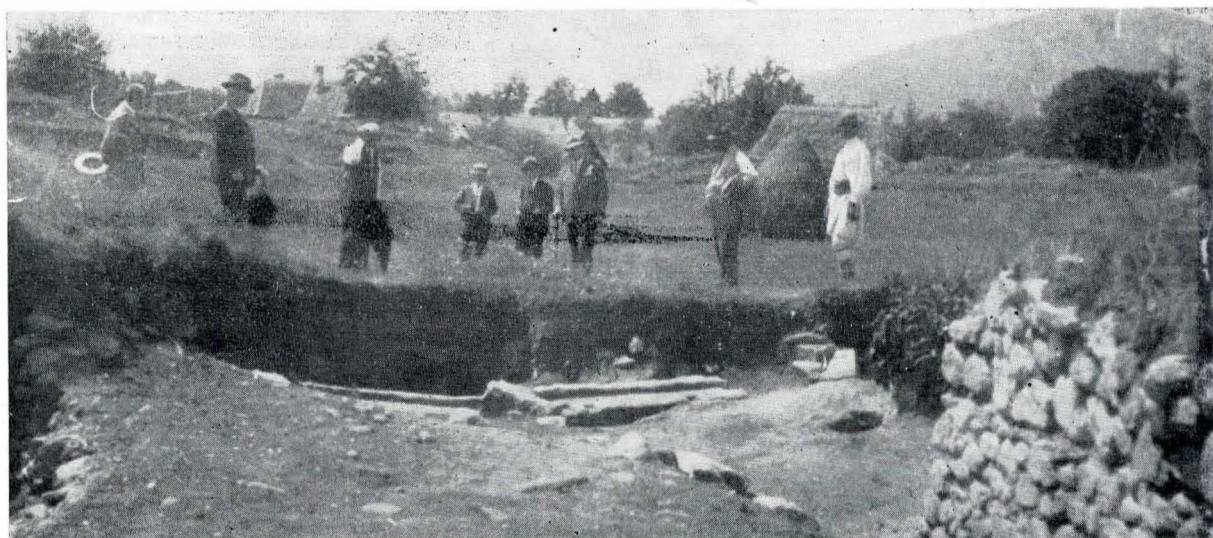
La Micia, în 1931.

viața politică aceea năsură, așa de rară astăzi, care nu l-a pus niciodată în conflict cu un adversar, căruia nu avea să-i opui decât o altă convingere 9 . Cu același prilej, Gh. Cipăianu îl numește „omul de știință, care a știut și știe să pună alesele sale însușiri spirituale și toate darurile sufletești în slujba neamului și a țării” 10 , iar într-un alt loc, că „s-a remarcat prin talent și disciplină, pondere și modestie, devotament și muncă concentrate într-un caracter ales de linii clasice” 11 .