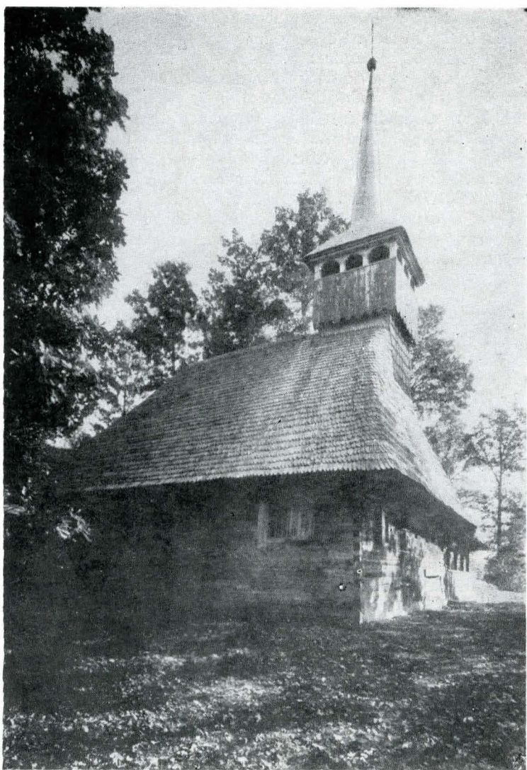
Biserica din Călinești.

aplicațiune al acestei legi. Momentul este propice, cel mai bun ministru al instrucțiunii publice din cîți a avut România — o spune N. Iorga, respectiv Spiru Haret, este cel care și-o însușește și o susține, tot așa cum susținea cultul trecutului ca pe o virtute cardinală. Așa apărea prima, și cea mai completă de pînă atunci, lege specializată în asigurarea bazei materiale și organizatorice privind ocrotirea patrimoniului cultural național. Căci, ca și celelalte legi ce-i vor urma (în 1913, 1919, 1932, 1940) ea încearcă să răspundă tuturor aspectelor legate de bunurile culturale. Astfel: definea bunurile mobile, institua Comisia Monumentelor Istorice, obliga la sistemul de raport anual, la evidență (prin inventariere), numea pe cei responsabili, ordona cercetarea și valorificarea.