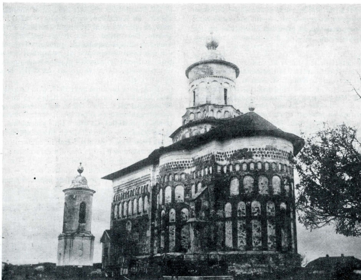
Biserica Maica Precista din Bacău. Fototeca Muzeului de artă al R.S.R. (Fond C.M.I.)

nota: „ Per restauro noi intendiamo la conservazione di ciò che esiste, la riproduzione di ciò che manifestamente è esistito ” 70 . Autorul proiectului concepea protecția astfel: „ Restaurare un edificio non significa mantenerlo, ripararlo o ripararlo, ma restabilirlo in uno stato d'integrità che può non essere mai esistito ” 71 . Pe acest fundal în care se combat idei postromantice, între care teoria „ruinismului” a lui Ruskin și cea a „unității de stil” a lui E. V. — le-Duc sînt cele două teze antagonice, teoria și practica îi împarte pe protagoniști în moderniști și paseiști, în care ultimii, prin viziunea lor pesimistă față de decăderea civilizației europene, vor fi înfrinți. Lucrul în sine și evoluția teoriei în sensul celor de mai sus sînt normale, dacă le raportăm la cuceririle de ordin științific și tehnic, căci opera de protecție nu este străină de aceste idei ce au o gravă rezonanță. Nu e decît un pas de făcut pînă la conștiința profesionalizată, de la constatările lui Goethe care-n Voyage d'Italie (p. 173) atrage atenția asupra pericolului de distrugere a frescei datorat fumului lumînărilor în cazul Capelei Sixtine — deci o primă luare de poziție față de relația mediu ambiant-operă —, pînă la cele ce privesc prejudiciile aduse operei de artă, de exemplu, de cei dintîi fotografi sau de cei