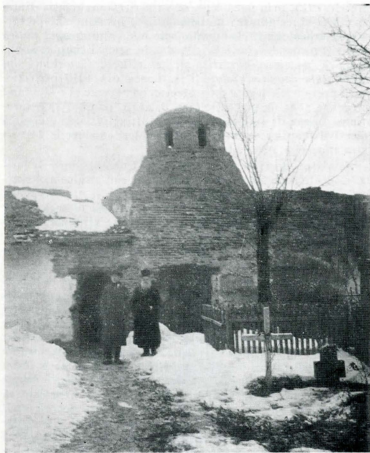
Cuhnia de la Plumbuita — București.

dintr-un vechiu monument 19 . Preocupați de documentația obligatorie și respect față de informația diversă de care dispune restauratorul, teoreticienii epocii nu se sfiesc să afirme că: „În principiu totdeauna se poate restaura un monument; dar punctul delicat este să i se păstreze neatinsă partea cea mai mare posibilă din construcția primitivă”; în privința reconstituirilor „trebuie să punem la locul lor și în ordinea primitivă vechile materiale, ori care ar fi ele: cărămizi ordinare sau pietre sculptate”, înlocuind tot ce este deteriorat și „avînd grija de a se lăsa aparente părțile noi ca să se poată deosebi cu înlesnire de părțile vechi ale clădirii 20 ”. Cîne lecturează volumul-manual „Restaurarea monumentelor istorice 1865—1890”, etalon și sumum ale practicii și teoriei vremii, dar consecutiv o lucrare de o însemnătate documentară covîrșitoare, înțelege cu cită greutate și ce forțe au antrenat restaurările de monumente din deceniile 8—9 ale veacului al XIX-lea. Istorici, arhitecți, sculptori și pictori, arheologi, oameni de cultură și conducători politici, se frămîntă în beneficiul aceleiași idei: să se respecte trecutul și respectiv istoria în opera de restaurare, dar totodată aceasta să fie științifică. Cristian Tell, alături de Al. Orăscu, K. Storck și Vasile Boerescu, N. Crețulescu, Al. Odobescu, I. Berindei, Dimitrie Bolintineanu, Th. Aman, T. Maiorescu, I. Slavici ș.a. discută, dezbate, hotărăse pe marginea „oamenilor competenți”, a stilului, a fondurilor, a