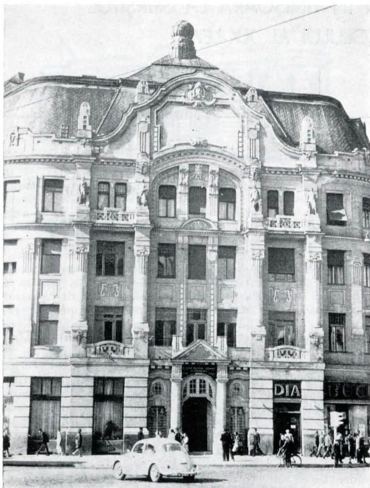
1. Clădirea Facultății de chimie

se poate urmări un ciudat amestec de decor floral, vrejuri și fluturi stilizați, ce se desfășoară sub arcade neogotice.