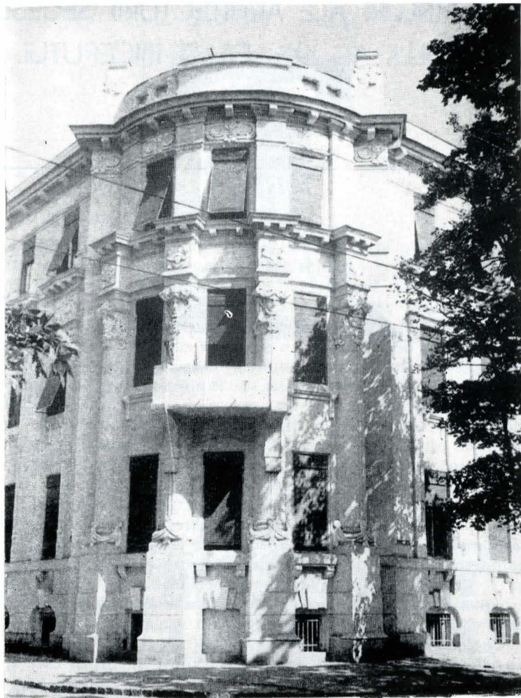
2. Imobil în stil Secession din str. 12 Aprilie 3

Întreg ansamblul este completat de gardul și intrarea în parc, formată din turnulețe masive cu profile curbe, care încadrează un portal rotund decorat în faianță, și de Podul