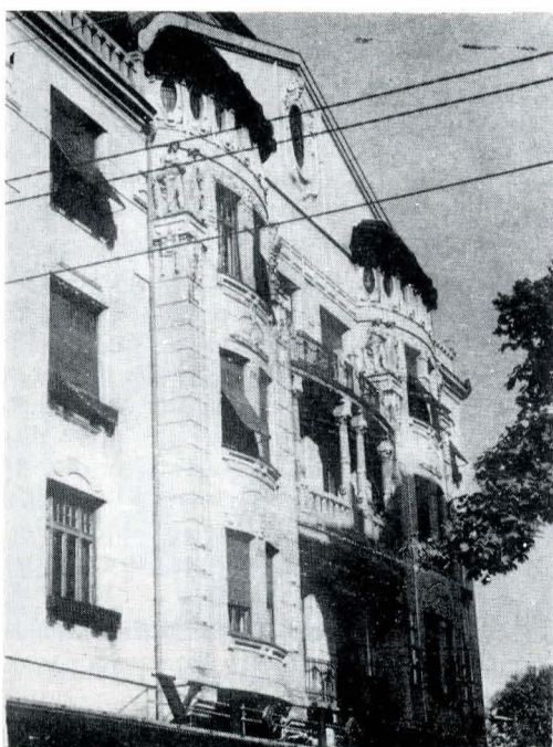
3. Imobil în stil Secession din str. 30 Decembrie 1