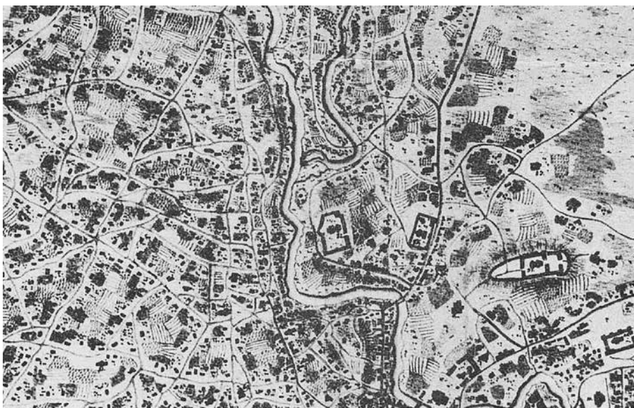
Fig. 6 Mănăstirea Radu Vodă și împrejurimile (detaliu din planul Bucureștilor de la 1790 al locotenentului Franz baron Purcel)