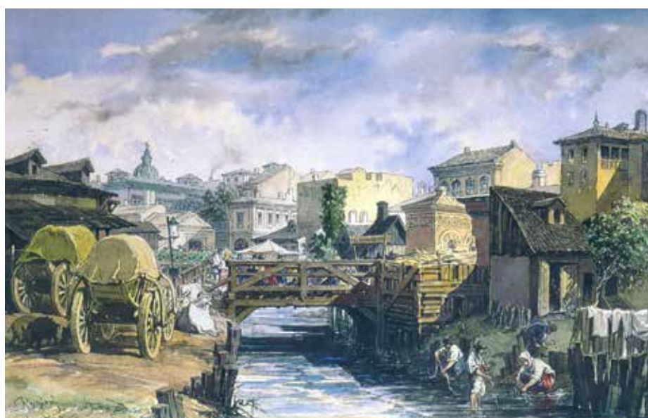
Fig. 7 Vedere unui curs de apă în București (pictură de Amedeo Preziosi, 1869)