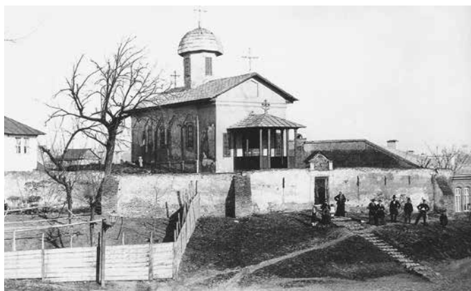
Fig. 4 Biserica Bucur văzută dinspre mănăstirea Radu Vodă (cca 1870)