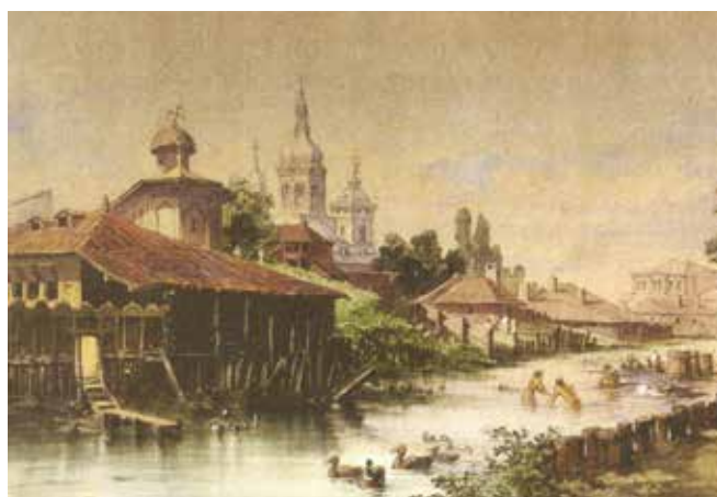
Fig. 1 Dâmbovița în preajma bisericii Bucur (pictură de Amedeo Preziosi, 1869)