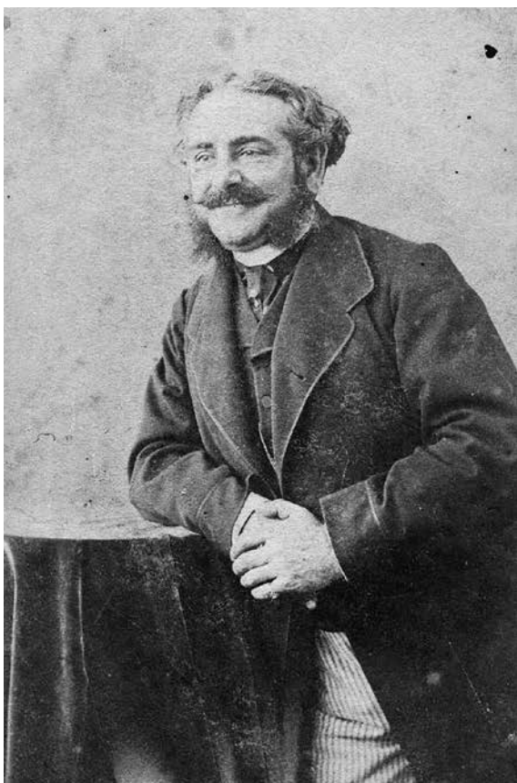
Fig. 2 Amedeo Preziosi (fotografiat către 1870 de Felix Tournachon, zis Nadar)