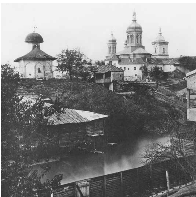
Fig. 5 Biserica Bucur văzută dinspre Dâmbovița (fotografie de Fanz Duschek, cca 1870)