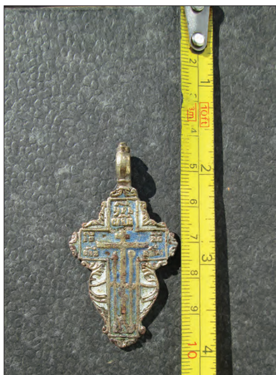
Fig. 3. Aversul Crucii

„Да воскреснет Бог, и разсеются Его враги, и пусть бегут от Него все ненавидящие Его. Как исчезает дым, так и они пусть исчезнут; и как тает воск от огня, так пусть погибнут бесы перед любящими Бога и знаменующимися знамением креста и в радости восклицающими: радуйся, Многочтимый и Животворящий Крест Господень, прогоняющий бесов силою на тебе распятого Господа нашего Иисуса Христа, Который сошел в ад и уничтожил силу диавола и дал нам Тебя, Свой Честный Крест, на прогнание всякого врага. О, Многочтимый и