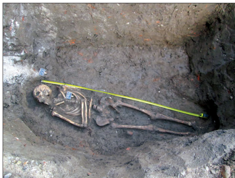
Fig. 2. Mormântul M4

Iconografic, în partea de sus a crucii se află inscripționat titlul celui care era răstignit. Din ordinul pe care Pilat la dat, deasupra capului lui Iisus, în momentul răstignirii Lui au fost pusă o tăbliță inscripționată cu patru inițiale. În prezent, de cele mai multe ori aceste inițiale apar inscripționate în alfabet latin sub forma I.N.R.I (prescurtare latină a expresiei: Iēsus Nazarēnus, Rēx Iūdāeorum ), dar, uneori, sunt întâlnite și în versiunea alfabetului grecesc sub forma I.N.B.I (prescurtare grecească a aceleași expresii: Ἰησοῦς ὁ Ναζωραῖος