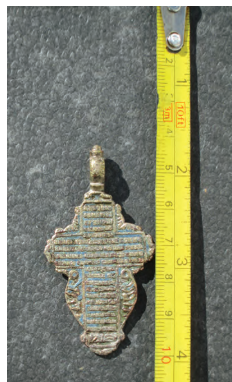
Fig. 4. Reversul Crucii

Животворящий Крест Господень, помогай мне со Святою Госпожою Девотою Богородицею и со всеми святыми во все века. Аминь.”