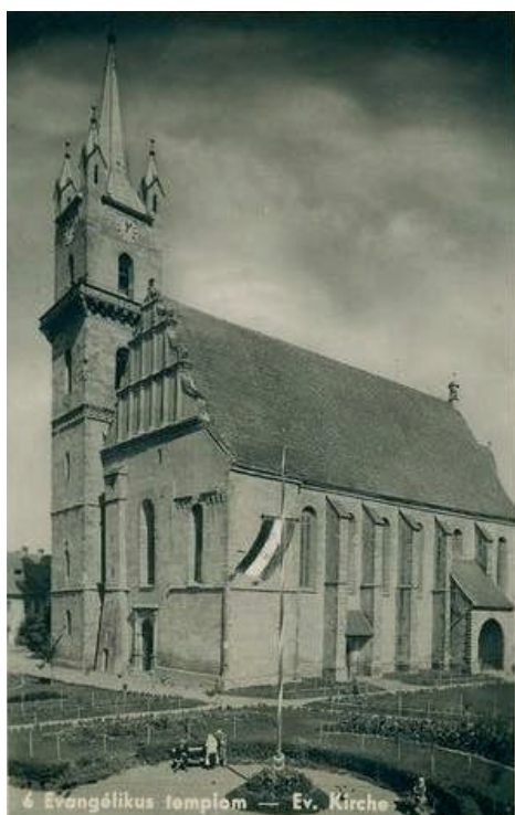
2. Steagul unguresc pe soclul din Piața Regele Ferdinand (actuala Piață Centrală).