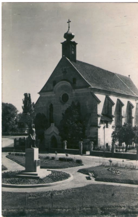
1. Statuia lui Andrei Mureșanu din Piața Unirii.

L'élévation de la statue d'Andrei Mureșanu, à l'initiative et avec le soutien de l'avocat et de l'homme politique Victor Moldovan, à Bistrița, monument dont la pierre du fondement a été mise en 1935 devant l'église grec-catholique, dans la Place Unirii, et qui a été dévoilée en 1938, est présentée par les auteurs en base des documents d'archive et de rapports de la presse du temps. En 1940, la statue est envoyée à Sibiu, suite à la cessation vers la Hongrie horthyste du Nord de la Transylvanie. Les démarches de 1946 pour faire revenir le monument et son nouveau remplacement, dans la Place Centrale de la ville, sont menées par la municipalité qui peut réinaugurer la statue au cours du printemps de 1947.