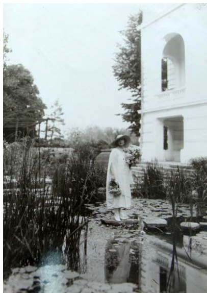
Fig. 1. Schiță ideală pentru suprafețele verzi ale unui oraș; Ideal sketch for the green areas of a city. Fig. 2. Regina Maria iubea parcurile; Queen Maria loved parks.