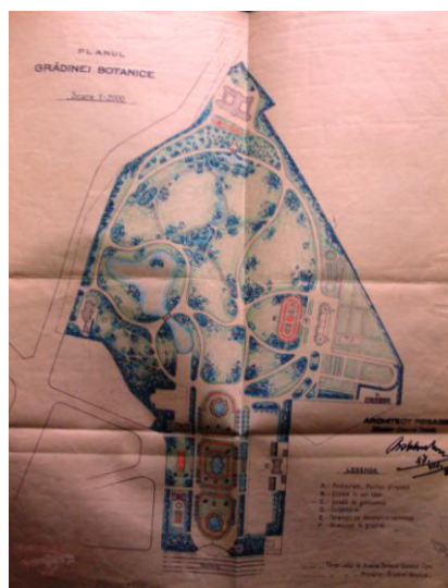
Fig. 3. Situația plajelor din București în anul 1930; The situation of beaches in Bucharest in 1930. Fig. 4. Planul Grădinii Botanice; The plan of the Botanical Garden.