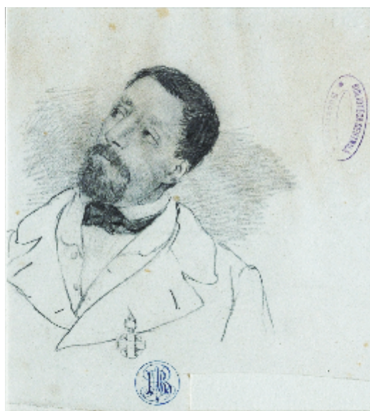
Barbu Iscovescu, Autoportret , (Biblioteca Academiei Române – Cabinetul de Stampe) Barbu Iscovescu, Self-portrait (Romanian Academy Library, Prints and Drawings Collections)