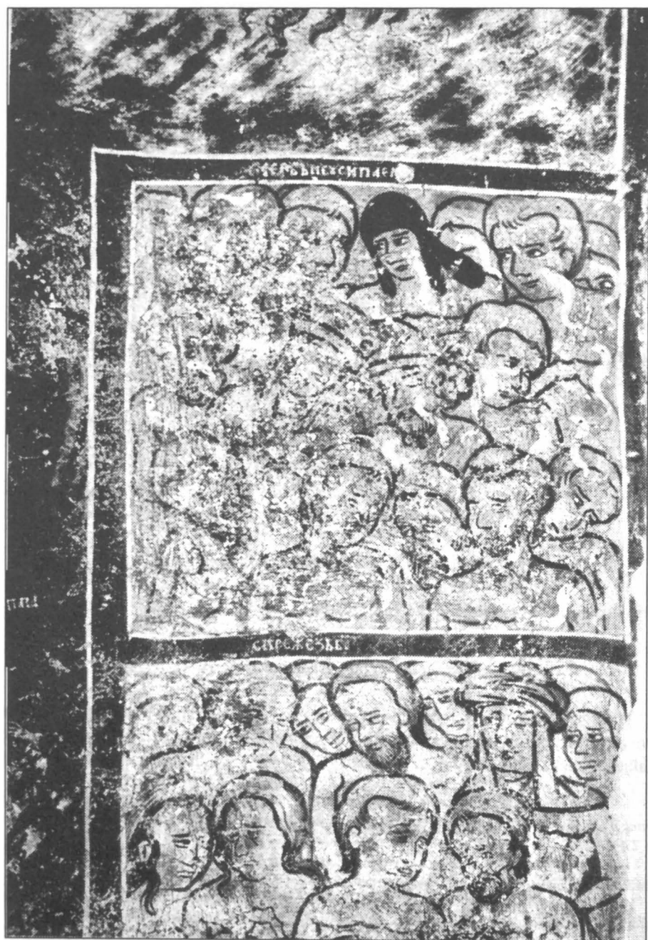
III. 1. – Monastero Humor.