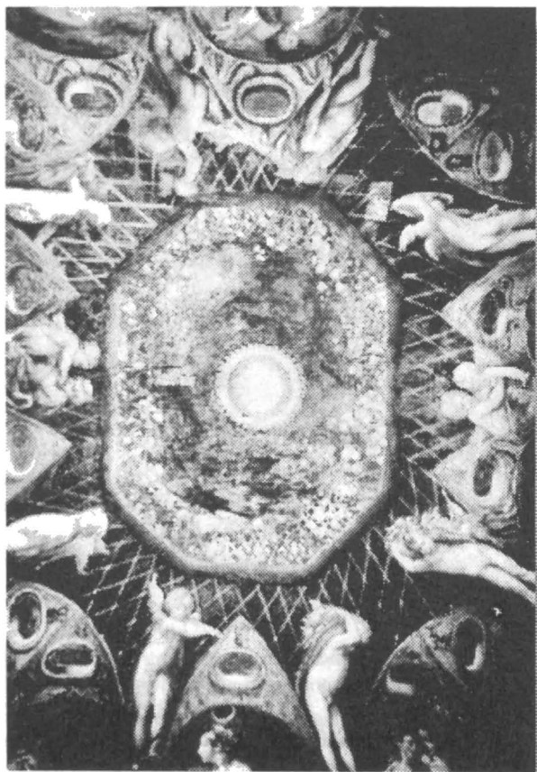
Fig. 2. – Parmigianino: Diane et Actéon , fresque, 1523–1524, Rocca di San Vitale, Fontanellato.

pourtant, ne serait-ce que d'une manière partielle, la justification profonde de la représentation maniériste : celle-ci n'implique plus exclusivement l'imitation de la nature ou de l'antiquité (comme dans la Renaissance), mais elle se plie sur l'imitation de l'idée, fait qui ouvre la voie royale de l'imaginaire » 10 d'où résultent d'autres conséquences : le passage de l'extériorité à l'intériorité, de l'objet au sujet, la révolte contre la forme classique, le triomphe de l'image, du dessin. 11 Ces assertions constitueront un bon point de départ pour une analyse des plus importants théoriciens maniéristes de l'art: Gian Paolo Lomazzo, L'Idée du temple de la peinture et Federico Zuccaro, L'Idée des peintres, des sculpteurs et des architectes .