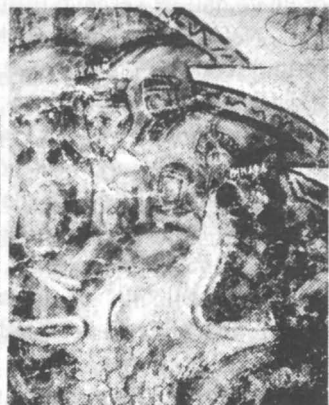
III. 3. – Il Monastero Voronet.