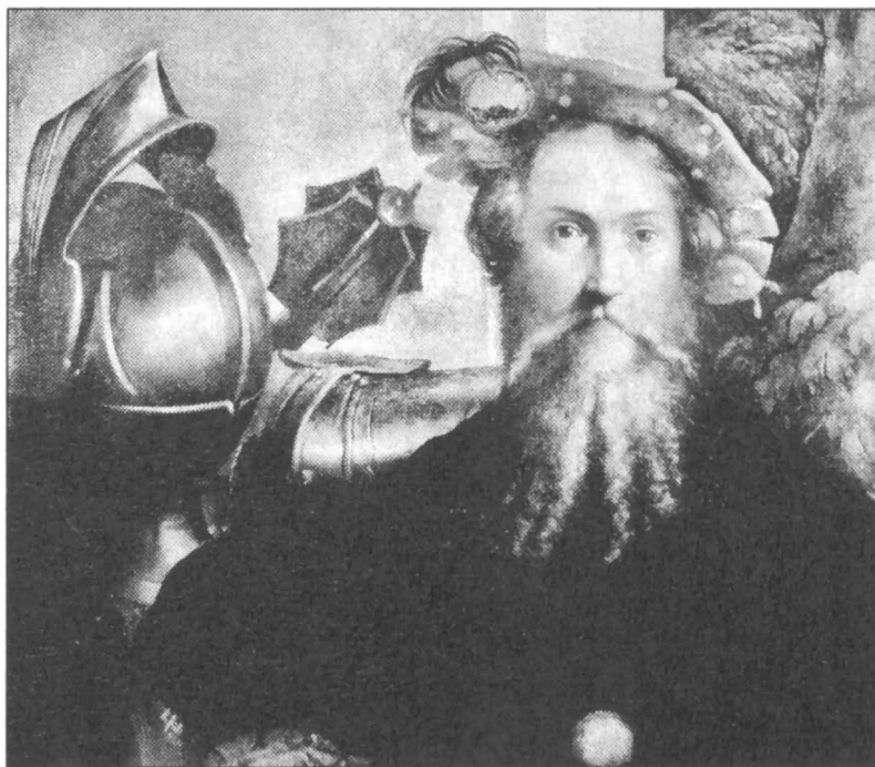
Fig. 3. – Parmigianino: Le Portrait du duc de Fontanellato , 1524, Galleria Nazionale di Capodimonte, Napoli.

l'intellect, sans forme ». 38 Dans la Renaissance, Alberti rapprochait la naissance de la peinture au mythe de Narcisse ; dans le maniérisme, la divinité tutélaire est Protée 39 , parce que peindre ne signifie pas copier la nature, mais transformer le visible et l'invisible en représentation esthétique. En conséquence, c'est le dessin intérieur qui est le noyau des images et des concepts de toutes les choses possibles, et le dessin extérieur, sa matérialisation.