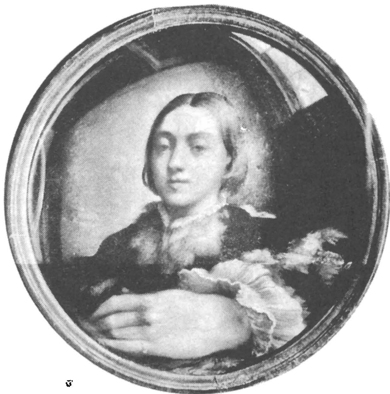
Fig. 1. – Parmigianino : Autoportrait dans un miroir convexe , 1523–1524. Kunsthistorisches Museum, Vienne.

« Distorsion of the form » c'est l'un des concepts-clé de l'ouvrage de Walter Friedlander 7 sur l'art du XVI e siècle. L'un des topos par lequel V.I. Stoichiță dans Pontormo et le maniérisme définit ce courant est, à côté de « l'image qui cherche son sens » 8 , « la forme en tant que déformation ». 9 Ces études renforcent l'affirmation du reflet dans le miroir convexe en tant que catégorie emblématique pour le maniérisme, reflet qui constitue un modèle pour la création de beaucoup d'œuvres d'art.