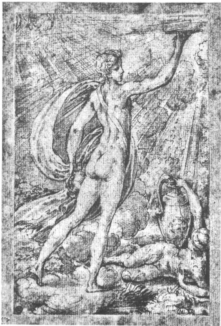
Fig. 4. – Parmigianino: Ganymède et Hébé , dessin, Paris, Louvre.

peinture=le miroir pour illustrer le principe de la mimésis subit une transformation dans le maniérisme, parce que l'œuvre d'art « devient » un miroir où prennent corps les idées, les représentations intérieures, un miroir qui suppose un reflet protéique qui ouvre la voie à « l'invention » ; il est, par conséquent, un miroir convexe qui soutient l'imagination par l'irréalité et la déformation des objets reflétés, un miroir où tout devient possible, un jeu de l'artifice.