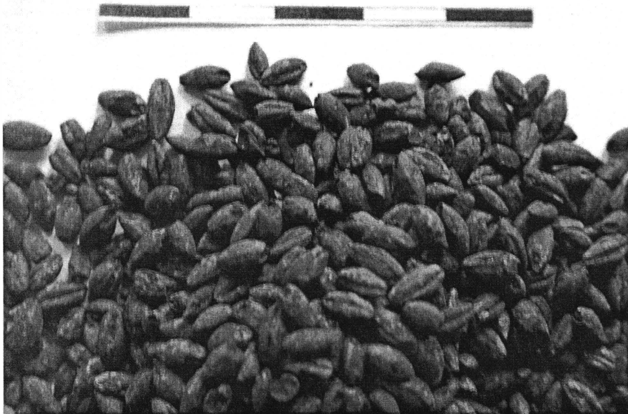
Fig. 4. Popești (sédiment, La Tène III): Hordeum vulgare .

– 24,88 g d'orge ( Hordeum vulgare ) (Pl. II, fig.4), 38 grains de millet ( Panicum miliaceum ), 9 semences de gaillet de bâtard ( Galium spurium ) et 2 grains de Triticum monococcum .