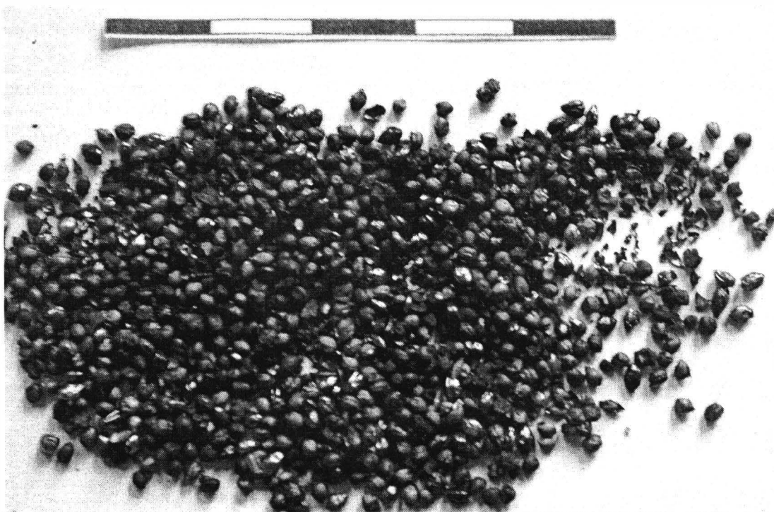
Fig. 2. Popești (fosse Hallstatt moyen): Panicum miliaceum .

– une fosse contenait 1,18g de millet ( Panicum miliaceum ) (fig.2), plus exactement 590 caryopses grains carbonisés, et seulement 3 g de grains de blé ( Triticum aestivum ).