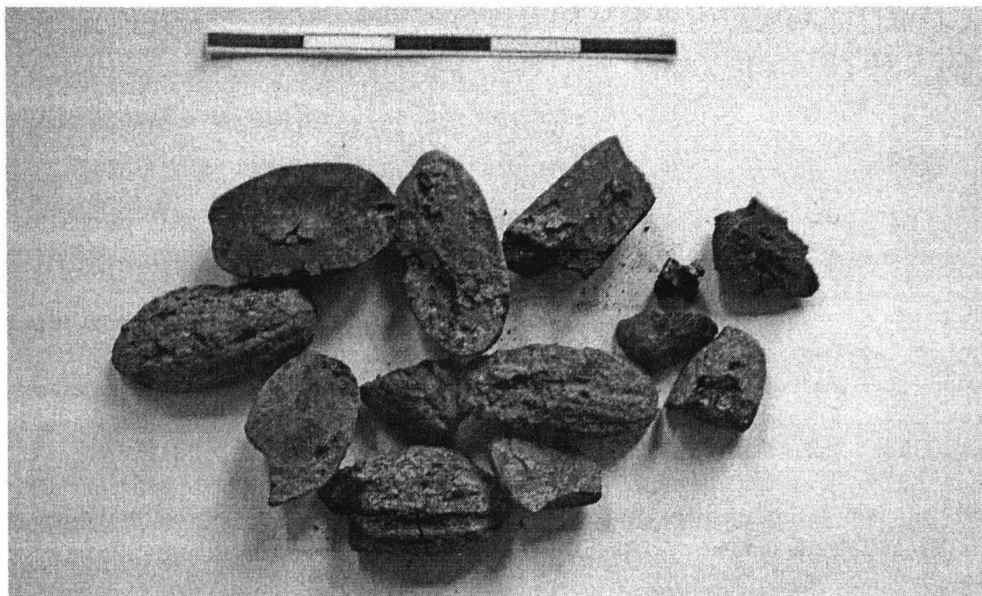
Fig. 1. Popești (débris d'une maison incendiée, Hallstatt ancien Pre-Basarabi): Quercus sp.

– dans la fosse 18, on a trouvé (selon l'un des journaux des fouilles): “une seule fève de blé carbonisé”; on ne peut pas confirmer s’il s’agit vraiment de la découverte d’une espèce de Triticum , dans cet ensemble, parce qu’il n’y a pas d’autre échantillon de cette période pour l’analyser.