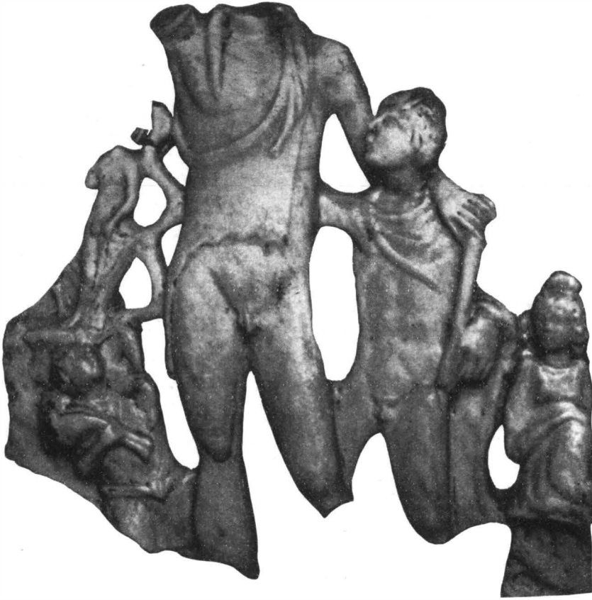
Abb. 12. — Bacchus-Relief aus Alba Iulia vom Typus Potaissa.

Es ergibt sich die Frage, in wie weit dieser Typus einheimische Züge verrät? Daicoviciu schließt aus dem Libera-Gewand, daß in der Art seiner Darstellung es an