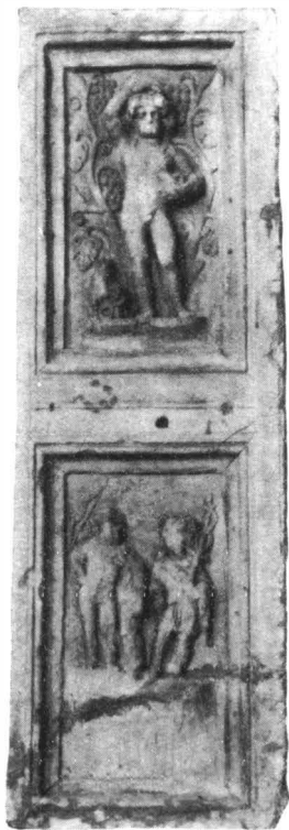
Abb. 9. — Türeinfassung mit Liber, Mercur und Herkules.

Angaben von CIL III 1095 nicht genau seien. Die Lesung des vor Libera stehenden Wortes als TRIF sei unrichtig, da der Votivaltar nur als Bruchstück erhalten ist und an Stelle von TRIF TRIET stehe, d.h. der zweite Teil des Wortes patri und