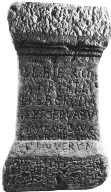
Abb. 10. — Votivaltar aus Zlatna.

das Bindewort et . Die richtige Lesung der ersten Zeile der Inschrift lautet also: Libero patri et Liberae .