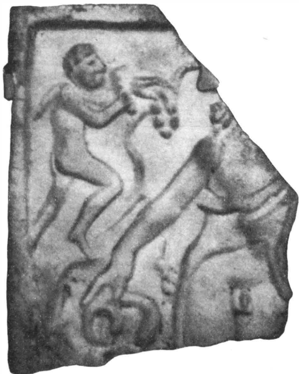
Abb. 5. — Bacchus-Relief aus Ilișua.

Die Verbreitung des Liber-Libera-Kults veranschaulichen die Fundorte der Denkmäler. Die meisten stammen aus Apulum (Alba Iulia) und Potaissa (Turda). Aus Apulum kennen wir 7 Inschriften 53 und 1 Votivdenkmal 54 , aus Potaissa weitere 7 Inschriften 55 und 4 Denkmäler 56 . Aus Mintia 57 und Zlatna 58 stammen je 1 Inschrift, aus Sarmizegetusa 1 Inschrift und 4 Votivdenkmäler 59 , aus Caransebeș 1 Inschrift 60 , aus Vețel (Micia) 61 3 Inschriften, aus Bucova 1 Inschrift 62 , aus Gernisara (Geoagiu) 1 Inschrift 63 , aus Valea Nandrolui 1 Inschrift 64 , aus Ilișua 1 Inschrift, 1 Bacchus-Statuette sowie