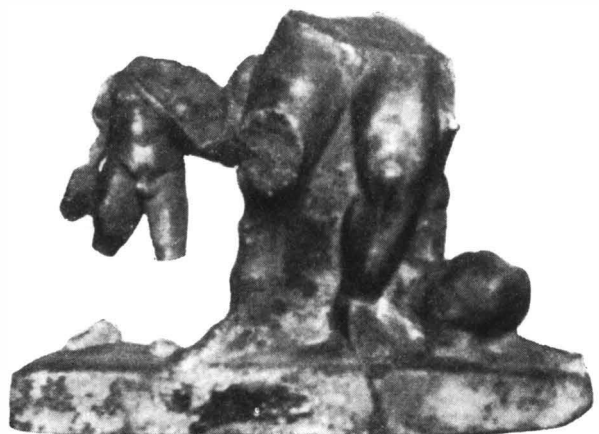
Abb. 6. — Bruchstück einer Bacchus-Statue aus Napoca.