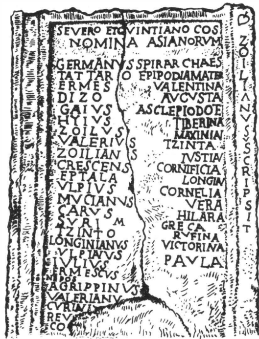
Abb. 11. — Inschrift der Spira aus Napoca.

Auf der Kolonne der Männer ist rechts zwischen dem 14. und 15. Namen ( Carus und Suri ) ein alleinstehendes M eingehauen. Es scheint, daß der Name Nepos später in die Lücke zwischen die beiden Namen geschrieben wurde. Der in CIL als