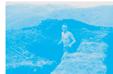
N. GUDEA CERCETÂND UN TURN ROMAN

Romanii au fost foarte practici, de aceea s-au adaptat în permanență în funcție de necesitățile pe care le aveau. Au integrat în Imperiu populații cu care fuseseră în conflict, preluând de la acestea tot de ce aveau nevoie, de la armament la religie, deși continuă, ca atitudine oficială, să păstreze niște standarde cât mai precise. Numărul mare de trupe de arcași orientali care încep să fie recrutați din sec. I p.Chr., a fost determinat în primul rând de reacția romanilor la amenințările din afara granițelor. Or, nu întotdeauna, se pare, era aplicată această strategie, dacii au fost mutați prin Anglia și Egiptul de azi, pentru a fi la o distanță apreciabilă de casă.