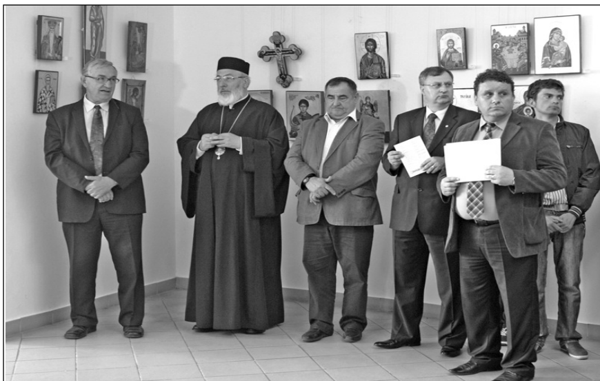
Imagine de la vernisajul Expoziției-concurs Naționale de Icoane „Rugămu-ne Ție!”, Curtea de Argeș, 7 iunie 2013