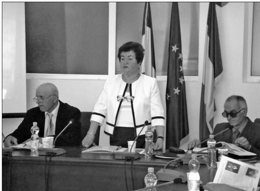
Moment aniversar pentru CJCPCT Vâlcea - Zilele Culturii Tradiționale din Vâlcea, 27-30 mai 2013, Râmnicu Vâlcea

care au sprijinit instituția sărbătorită de-a lungul celor 45 de ani de activitate.