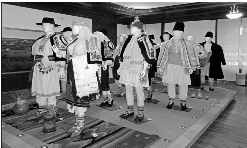
Alai tradițional de nuntă din județul Botoșani, în Muzeul Județean Botoșani – Secția Etnografie