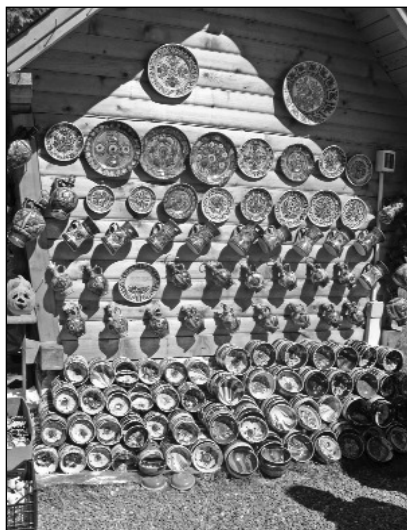
Ceramică de Corund la Târgul de la Horezu

„La Horezu, în județul Vâlcea, se produce una dintre cele mai frumoase și rafinate ceramici românești. Elementele tradiționale, vechile forme și motive menținute de-a lungul timpului, cu ajutorul cunoștințelor și tehnicilor specifice, transformă olăria de aici în obiecte de artă și de civilizație.