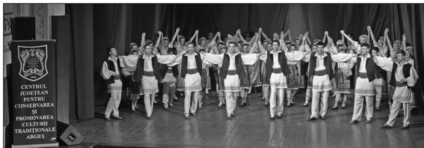
Ansamblul „Dorul“ - tineri - Marele Premiu al Concursului „Gheorghe Popescu-Județ“, Pitești, 25 mai 2013