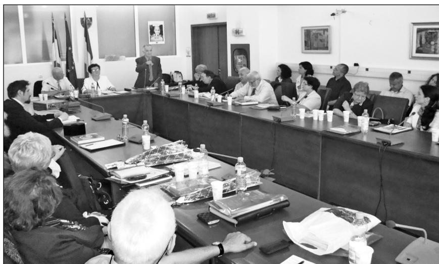
Imagine de la etapa a II-a a Consfătuirii naționale, Râmnicu Vâlcea, mai 2013

Momentul aniversar propriu-zis a cuprins mesaje din partea autorităților vâlcene, a instituțiilor și a organizațiilor partenere, precum și decernarea diplomelor aniversare personalităților vieții culturale, științifice și artistice