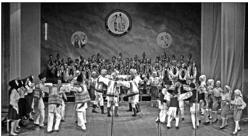
Formația de dansuri „Trei generații” din Flămânzi, jud. Botoșani, la aniversarea a 45 de ani de la înființarea CJCPCT Botoșani – 16 mai 2013

de orchestre, formații corale și de jocuri populare de toate vârstele - de la copii și elevi, la tineri și maturi.