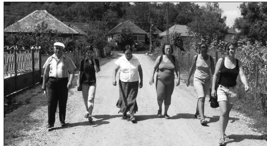
Cercetarea din județul Sălaj la final

După moartea soțului său, în mai 1993, nevoia de supraviețuire, dar și puterea creativității s-au dovedit a fi resorturile ce au propulsat-o ca artistă. Aș putea spune, fără teama de a greși, că abia atunci am observat, noi cei ce le-am urmărit demersurile creatoare ale tuturor ceramiștilor din