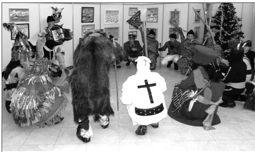
Ansamblul folcloric „Drumul Baltagului” din Borca, jud. Neamț, la vernisajul expoziției - decembrie 2012

- Doamnă, noi am fost nu bogați, da' nici săraci, săraci; am fost mulți în familie.