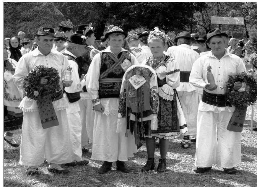
Miri din Cupșeni - Țara Lăpușului, jud. Maramureș