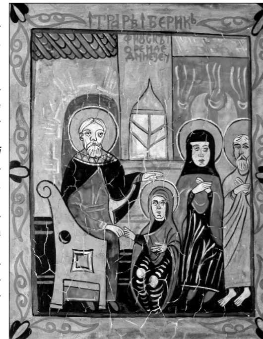
Intrarea Maicii Domnului în biserică - Florentin Cantaragiu, (Moara Vlăsiei, jud. Ilfov), Premiul III la secțiunea Icoane pictate pe lemn

Mădălina MUNTEANU Referent, CNCPT Fotografii de Dănuț DUMITRAȘCU , Consultant artistic CNCPT