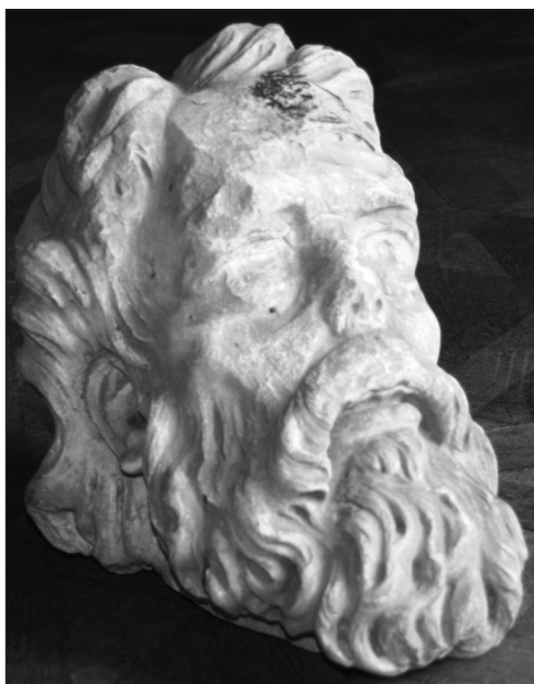
Fig.1. Cap de Profet, inv. S.327, nesemnat, nedatat, sec. XV(?), atelier transilvan, marmură, Colecția de sculptură a Muzeului Țării Crișurilor Oradea.

Lucrarea se evidențiază prin expresivitatea feței redată în momentul unei revelații, sugerată prin capul și privirea ridicate spre cer. Proporțiile capului (din punct de vedere antropologic de tip oligocefal din aria nord germanică) sunt mult prea exagerate față de canoanele clasice grecești, prin alungirea feței și nasul mult prea scurt. Epiderma în pliuri asemănătoare icoanelor medievale, evidențiază o față slăbită, osoasă pentru redarea cât mai fidelă a stării ascetice și a vârstei înaintate. Fruntea este prelucrată cu volume mari, plate, nefinisate, ochii cu privirea spre lumea transcendentală fiind abia schițați, aplatizați pentru impresia de iluminare în timpul unei viziuni. Cu zone nefinisate și zone șlefuite pe obraz, gura este întredeschisă într-o stare de rugăciune, evlavie; urechile specifice unei vârstei juvenile, sunt reprezentate naturalist, iar părul, mustățile, barba sunt descrise amănunțit prin bucle voluminoase