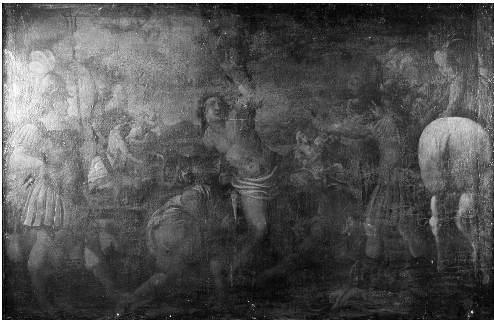
2. Anonim, Sfântul Sebastian , inv. 22, pictură retrocedată Episcopiei Romano-Catolice din Oradea în anul 2008, în baza sentinței civile nr. 2496 /03 aprilie 2008