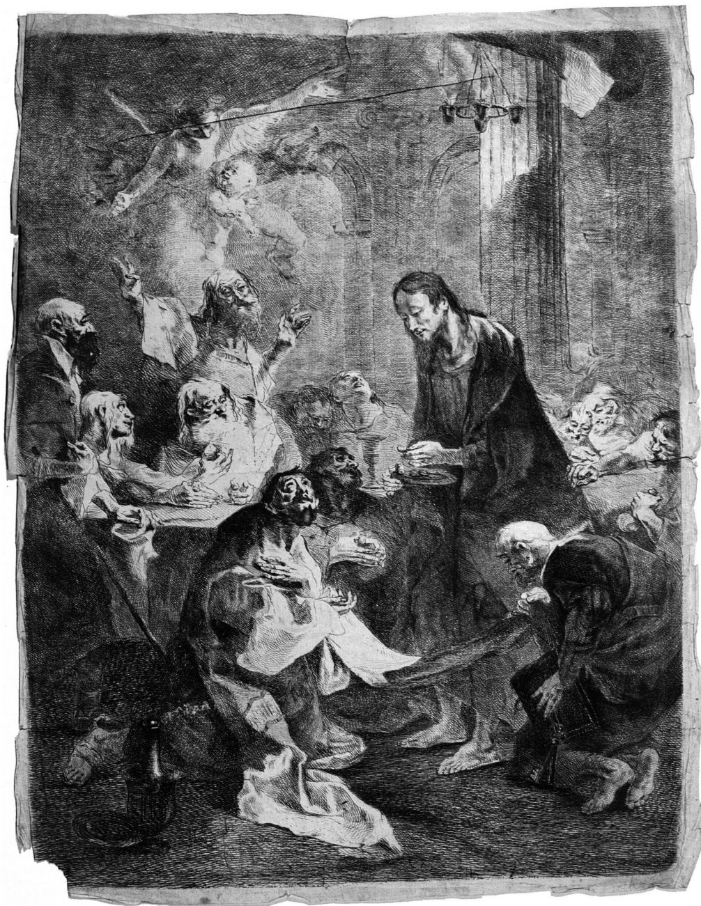
4. Necunoscut, Sfânta împărtășanie, inv.1, grafică retrocedată Episcopiei Romano-Catolice din Oradea în anul 2013, în baza sentinței civile nr. 990/28.01.2013