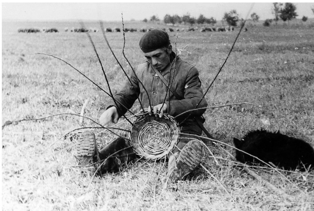
Fig 23. Păstor împletind pe câmp