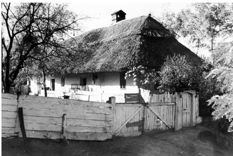
Fig 25. Casă acoperită cu stuf la Sălacea, Bihor