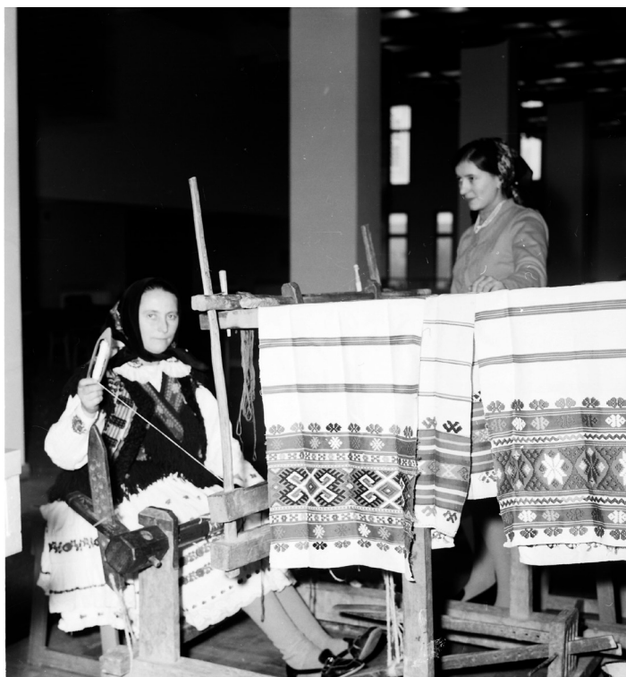
Fig 8. Țesătoare din Gurani, Bihor, 1973