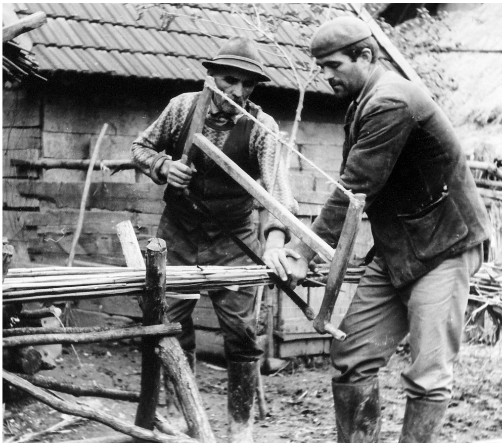
Fig 24. Tăierea stufului la Sălacea, Bihor