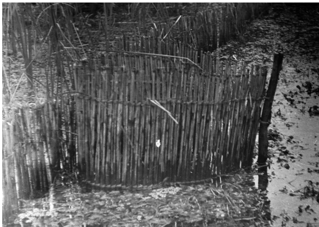
Fig 12. Lesă de pescuit în apele Văii Erului