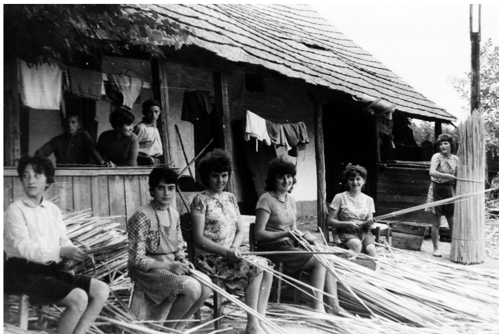
Fig 22. Fete împletind papură la cooperativa de profil din Sălacea, Bihor