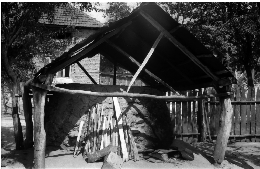
Fig 2. Cuptorul de oale a lui Bursașiu Ilie din Săliște de Vașcău, Bihor, 1969