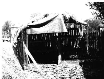
Chirnogeni – Case