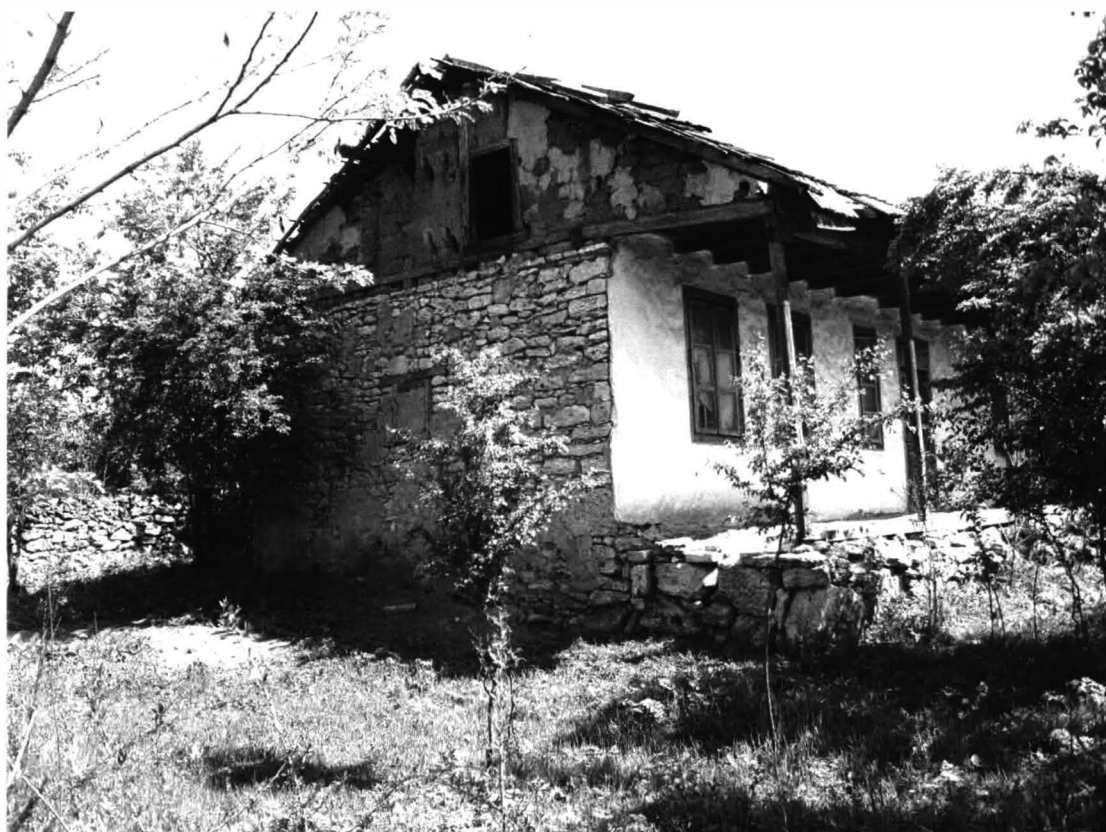
Chirnogeni – Casa nr.3