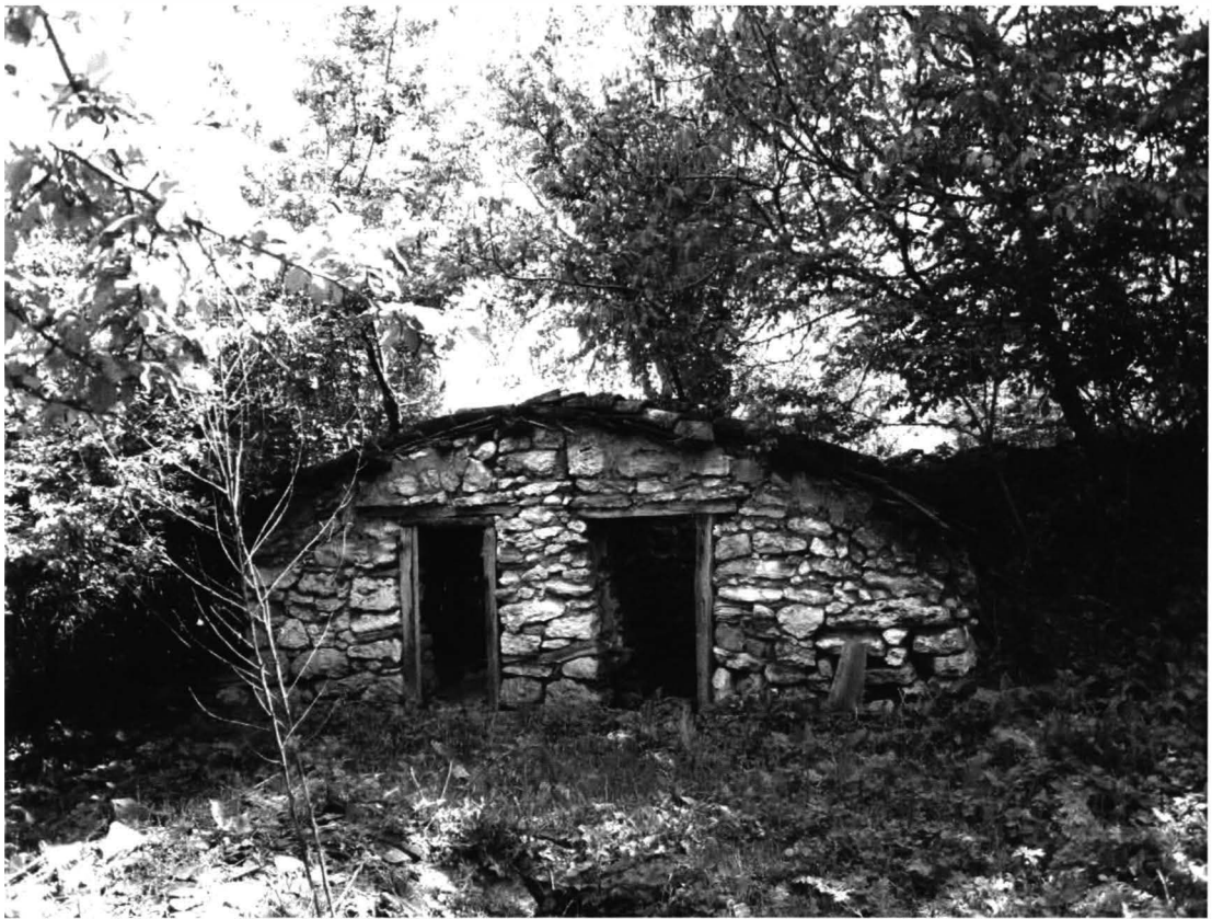
Coteț pentru păsări („curnic”) din Chirnogeni