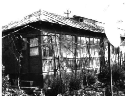
Chirnogeni - Case