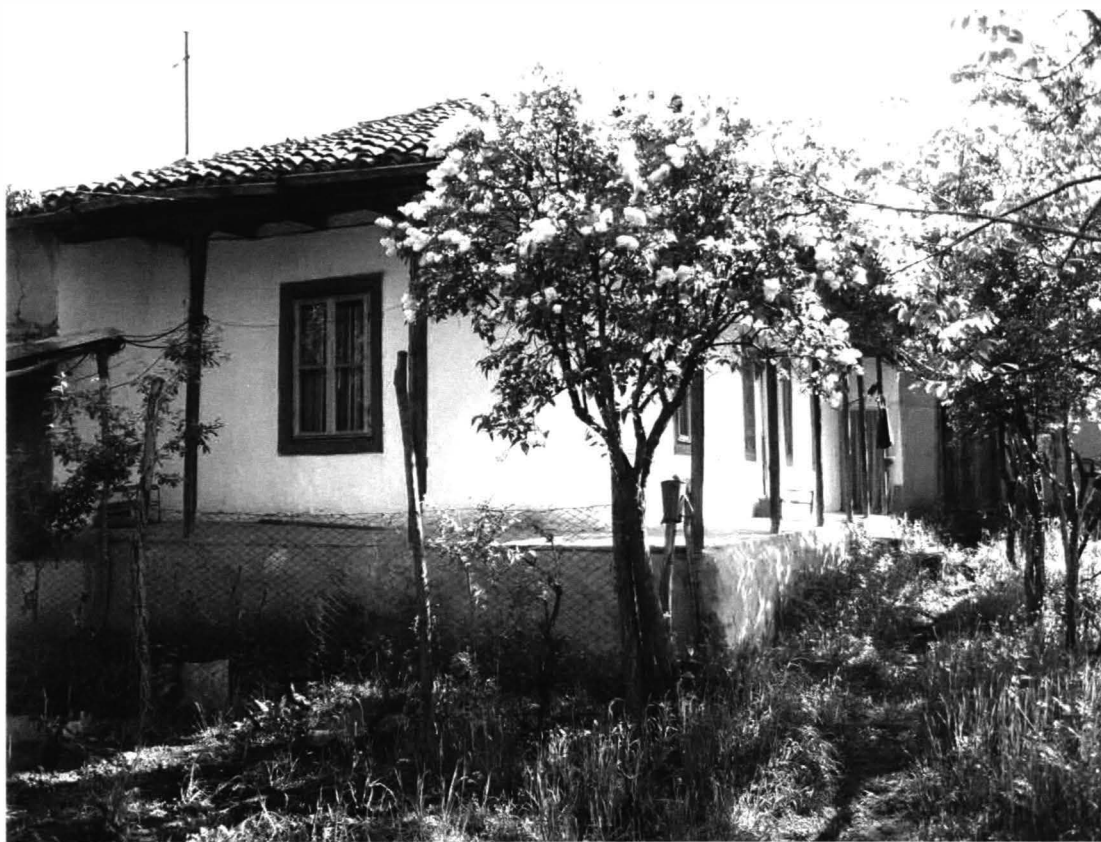
Chirnogeni – Casa nr.1

Gardul este din piatră, netencuit, și are un aspect neîngrijit, ca și curtea.