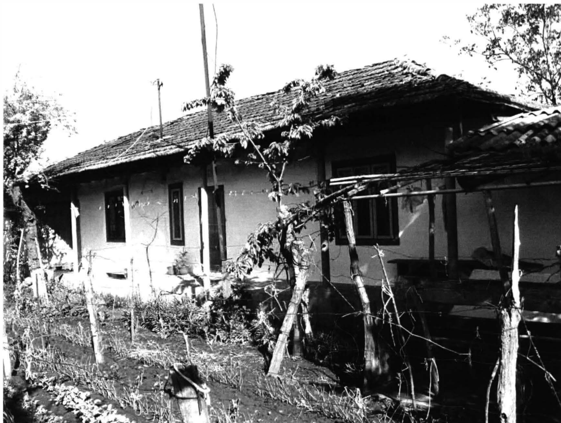
Chirnogeni – Casa nr.2