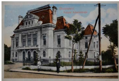
Fig. 4. Prefectura județului Botoșani