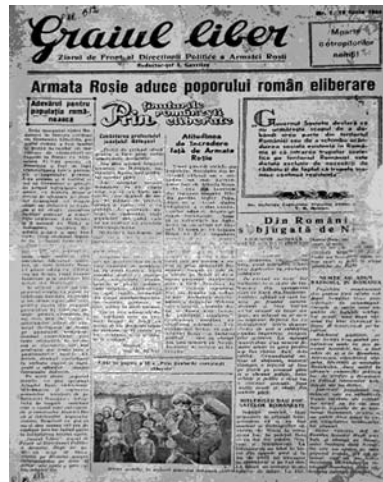
Fig. 2. Primul număr din 19 iunie 1944