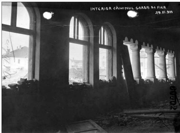
Fig. 3. Inside the Cămin, 29 November, 1933