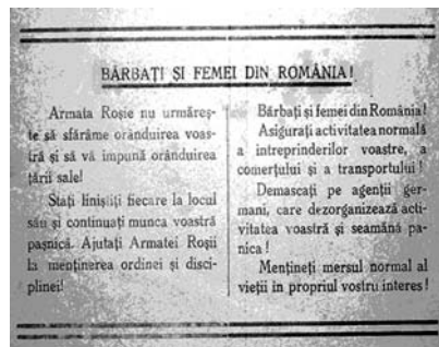
Fig. 5. Afîșe propagandistice emise de Comandamentul Armatei Roșii