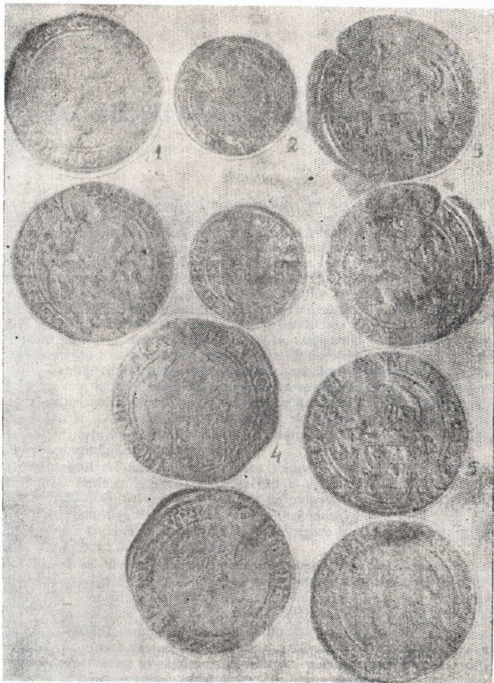
FIG. 3 — Monede din tezaurul de la Voetin