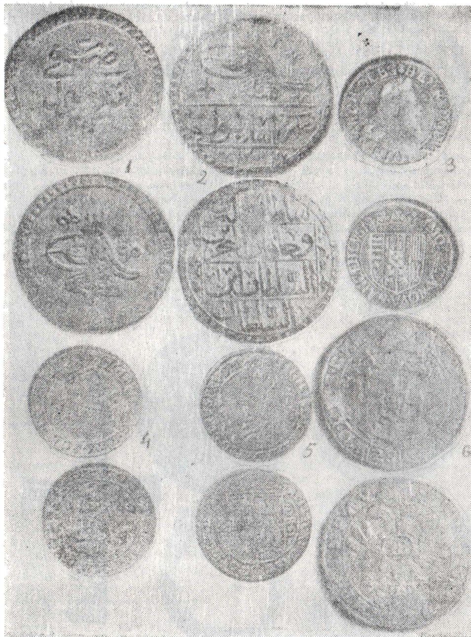
FIG. 2 — Monede din tezaurele de la Cîrlighe și Voetin