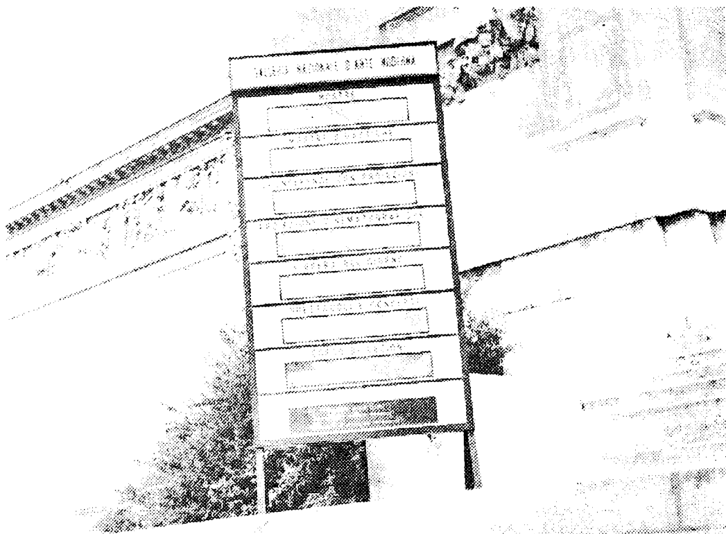
ROMA — Muzeul de artă modernă : tipuri de acțiuni cultural-educative.

se 3. Această legătură directă bazată pe colaborarea muzeu-școală evidențiază în concepția muzeologilor și pedagogilor englezi și direcția efortului maxim și principal : publicul școlar. Odată format la nivelul vârstei școlare, acest public căruia i se adresează și alți factori de instruire și educație (bibliotecă, teatru, mijloace mass-media, turismul etc.) va deveni, pentru muzeu, publicul de mâine.