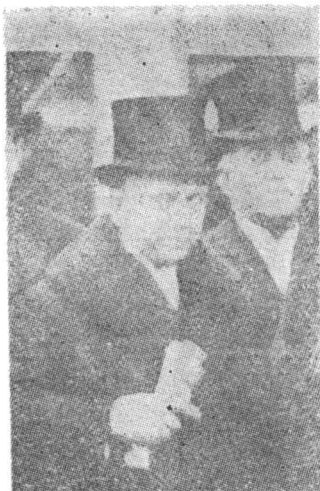
Abb. 4. Ion Lapedatu und Octavian Goga (Foto aus der Bibliothek der Aka- demie der SRR).