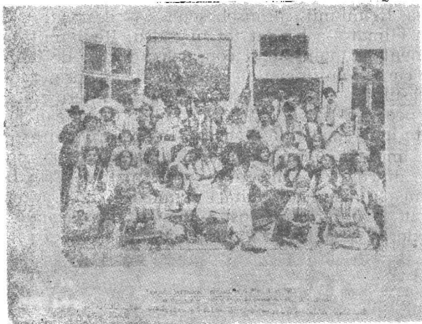
Fig. 3. Tabloul „La Șezătoare” prezentat la 4 mai 1913 de „Reuniunea de cîntări și muzică din Caransebeș”.

Fig. 3. Le tableau „À la veillée” présenté le 4 mai 1913 par „La Réunion de chansons et musique de Caransebeș”.