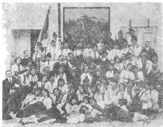
Fig. 4. Opereta „Crai Nou” prezentată în 1914 de „Societatea română de cîntări din Caransebeș”.

Actul Unirii Transilvaniei și Banatului la România este privit cu legitimă mîndrie de coriștii caransebeșeni care își trimit delegații lor la adunarea cea mare. Cîntînd sub faldurile drapelului, solii Caransebeșului urcă în cetatea de la Alba Iulia la 1 decembrie 1918, pentru a participa la marea sărbătoare.