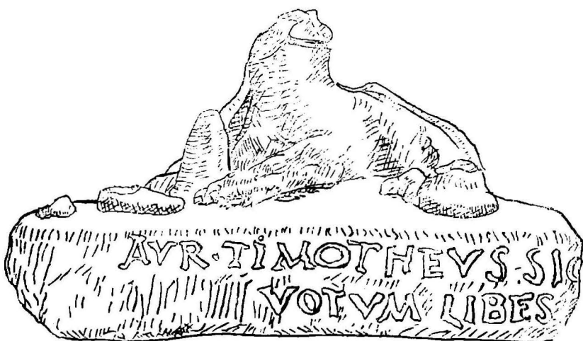
Fig. 11. Relief cu inscripție. Abb. 11. Relief mit Inschrift.