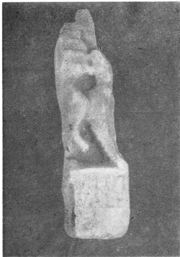
Fig. 6. Relief cu inscripție. Abb. 6. Relief mit Inschrift.