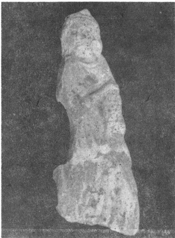
Fig. 10. Menadă. Abb. 10. Menade.