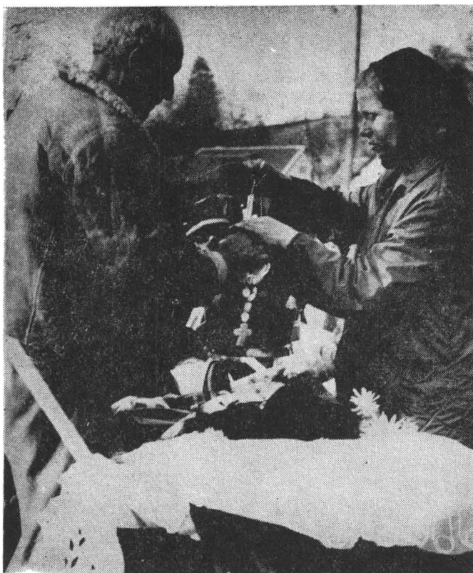
Fig. 3. Darea pomenii peste mormânt — Virciorova.

Rămîne totuși o oarecare preocupare. De trei ori în fiecare an (în noaptea de Paști, în noaptea de Anul Nou și în Joia Mare) aprind lumînări la cimitir. În Joia Mare aprind și foc la cruce. Se obișnuiește ca la praznic să se facă șase prescuri din care se dă ultima cuiva la mormînt.