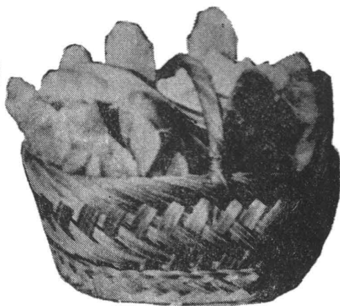
Fig. 2. Prescuri — Valea Timișului.

sfințit se aruncă câteva boabe în alimente de fiecare dată cînd fac pomană. Vedrele sînt împodobite de colaci, turte, cornuri, luminări, basmale, bomboane. Alții aduc pomană în „stecurătoare” (țesătură de lînă ornamentată prin alesături). Însotindu-l la cimitir, femeile bocesc, îl cîntă pe mort. Alaiul se oprește des. Aceste „odinătoare” (loc unde se opresc) sînt organizate rînd pe rînd de cineva din neam pentru a da „peste mormînt” (sicriul neacoperit) obiectele și mîncărurile, adică pomana destinată rudelor.