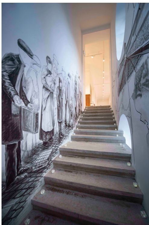
Fig. 4 – Oradea – goliță de locuitorii evrei.