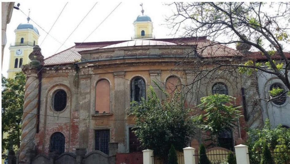
Fig. 1 – Sinagoga Ortodoxă „Aachvas Rein” înainte de reabilitare (2016).