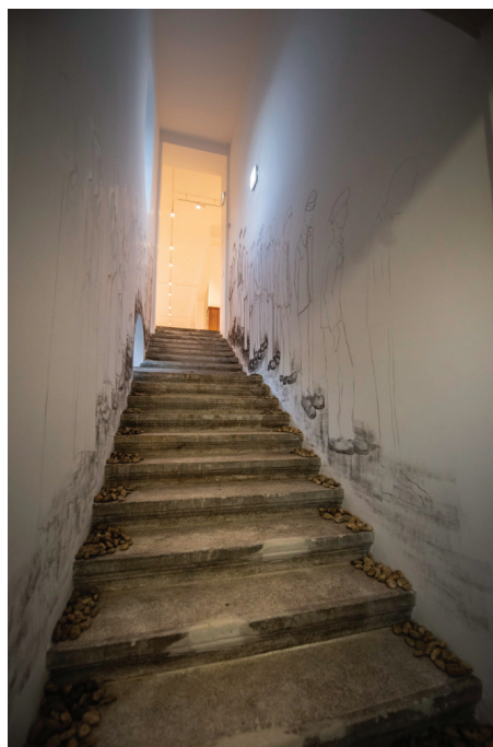
Fig. 8 – Dezumanizați în lagărele naziste.