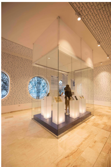
Fig. 5 – În onoarea doamnei Tereza Mózes.