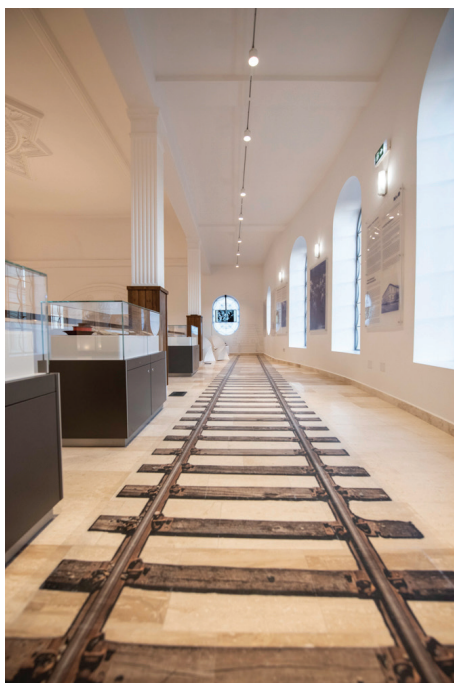
Fig. 7 – „Trenurile morții”.