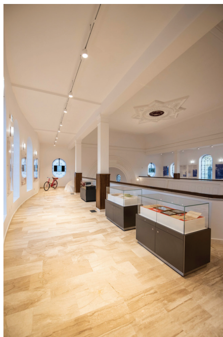
Fig. 6 – În amintirea Évei Heyman.