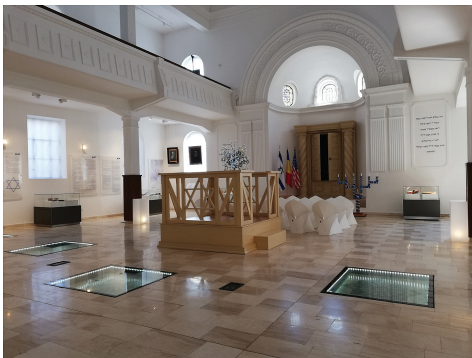
Fig. 3 – Omagiu Comunității Evreiești din Oradea.