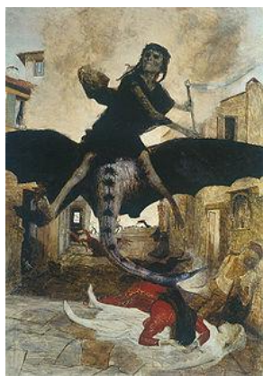
Arnold Böcklin Plague , 1898

Keywords: plague, european literature, epidemic, history, politics, apocalyptic fiction, Images of plague