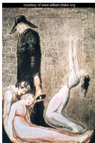
William Blake The Great Plague of London , 1794