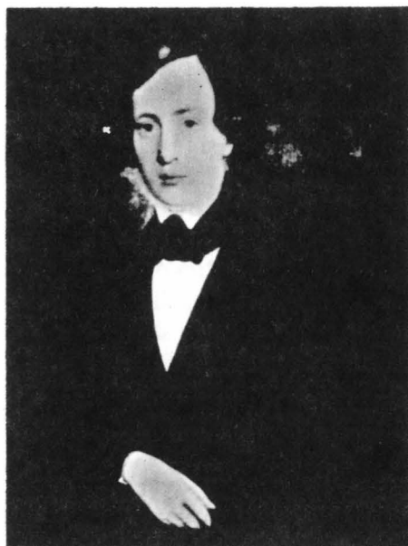
Fig. 1. Gheorghe Panaiteanu-Bardasare, portret de Gh. Năstăseanu

Române, dau multe amănunte asupra vieții tinerilor aflați la studii în străinătate, la începutul anilor '40 ai secolului trecut. Nici unul dintre biografii lui Gheorghe Panaiteanu-Bardasare 4 nu a cercetat și publicat până acum aceste două epistole, de certă valoare documentară și de mare importanță pentru lămurirea relațiilor dintre discipol și magistrul, ca și dintre învățăceii aflați departe de țară. A.D. Atanasiu, profesor de perspectivă la Școala de Belle-Arte din Iași și apoi directorul ei în perioada 1933-1937 (și ginere al pictorului Constantin Stahi, fost profesor și director al aceleiași instituții), care, de-a lungul mai multor ani, s-a ocupat, cu sârg și pasiune, de cercetarea începuturilor învățământului artistic în capitala Moldovei și de personalitatea lui Panaiteanu-Bardasare, în mod special, a dat la lumină o bogată corespondență a lui Gheorghe Asachi către protejatul său 5 , dar nu și invers; oricum, din acest schimb epistolar, prima scrisoare comentată de el datează din decembrie 1842 6 , iar exemplarele de la Academie o preced cu unu și, respectiv, doi ani.