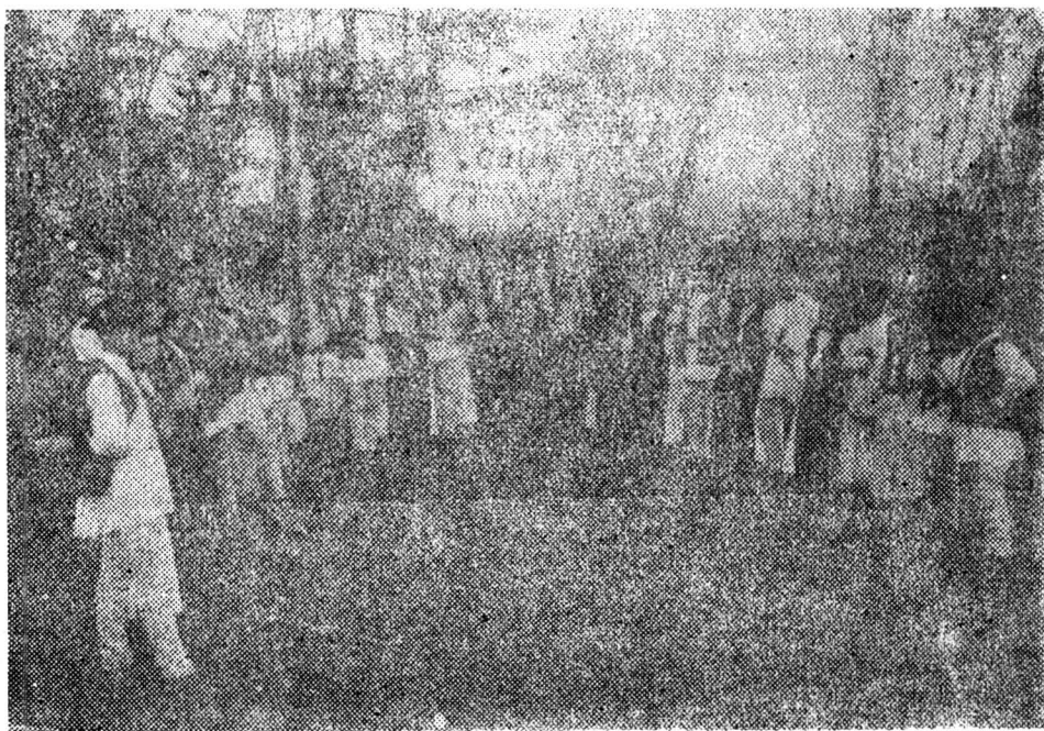
Cuvîntul adresat la Alba Iulia de către episcopul Miron Cristea către poporul din „Țara Hațegului”.