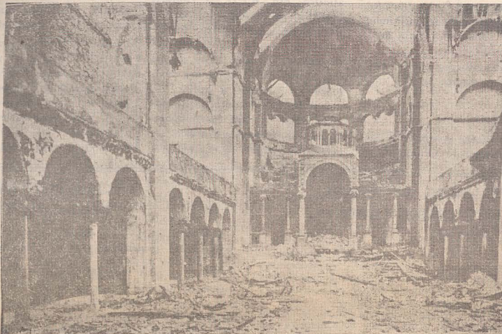
Sinagogă distrusă în „Noaptea de cristal”

45 de ani de la pogromul din 9—10 noiembrie 1938 din Germania