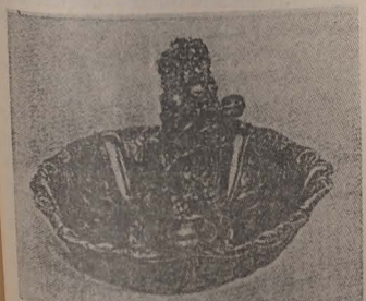
Exponat din Muzeul Evreiesc din Roma: obiect de cult

Procurorul general Heinz Hauelsen a evocat asasinările barbare comise în Lituania de către SS-ști. Pînă la sfîrșitul anului 1941 au fost uciși aproape 140 000 de evrei. Se sîpau gropi adînci, în care intra primul rînd de victime. Acestea erau împușcate de SS-ști aflați la marginea gropii. Apoi era împins în groapă al doilea grup, care cădea și peste oameni încă vii. Se trîgea a doua salvă; urmau tot așa altele, pînă se umplea groapa. Masa de evrei din groapă încă mișca cînd peste victime s-a aruncat var și pămînt.