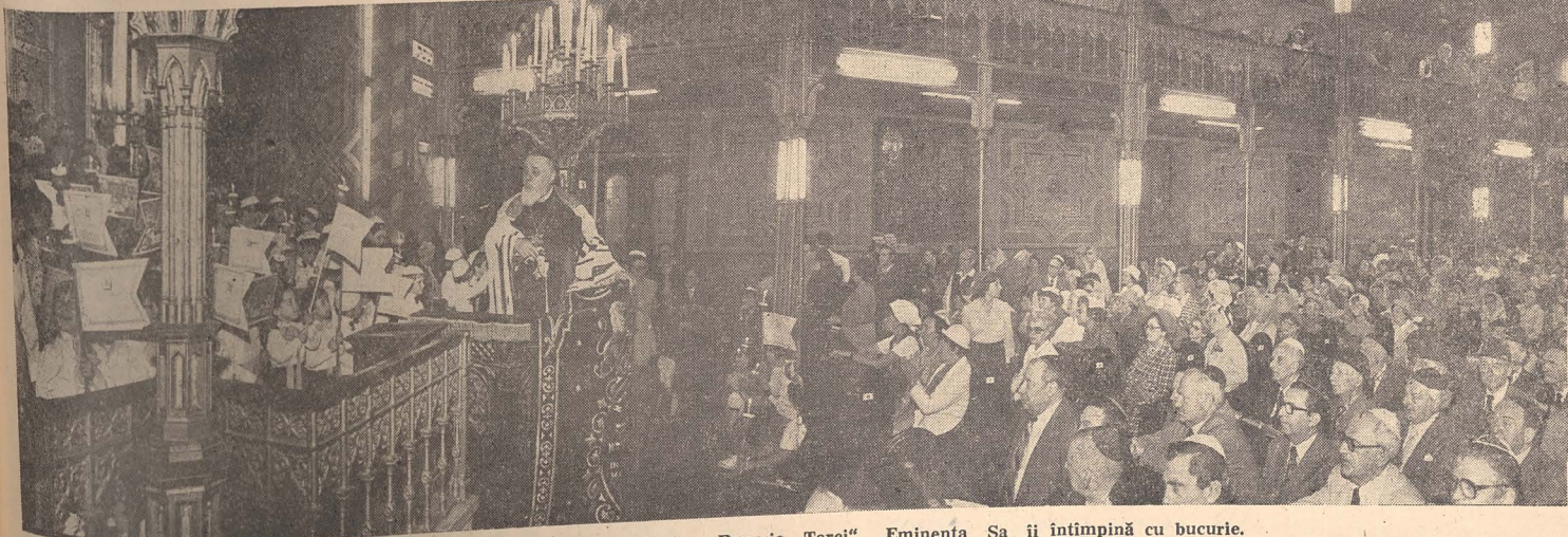
Încă o generație de cursanți prăznuiește „Bucuria Torei”. Eminența Sa îi întâmpină cu bucurie.