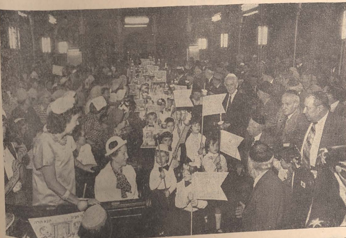
Stegulețe și torțe sui generis