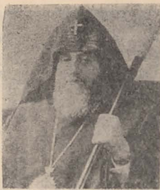
Doctor MOSES ROSEN

Doctor MOSES ROSEN, ȘEF RABINUL CULTULUI MOZAIC DIN REPUBLICA SOCIALISTĂ ROMÂNIA