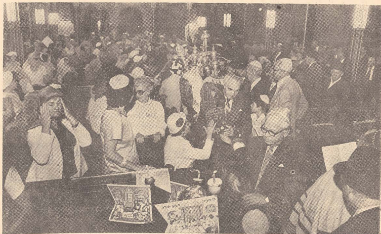
Cortegiul dănțuiește cu cartea în brațe