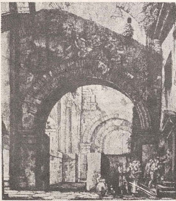
Portico D.Ottavia, intrarea în ghetoul din Roma (gravură din sec. XVIII).

De cele mai multe ori gheto-ul era un loc prea restrîns pentru a putea cuprinde întreaga populație care urma să fie concentrată acolo. De aceea se cerea un deosebit spirit de organizare pentru a preveni molimile și a se instaura o viață cît de cît normală, mai ales la început. Cu timpul, acolo unde autoritatea statală îngăduia o organizare proprie, s-au înființat organisme comunitare, care conduceau viața socială, religioasă și culturală. Aceste instituții se dovedesc atît de eficiente încît începuseră nu numai a fi consi-